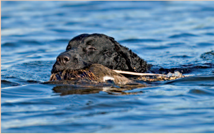
Met zwemmen doet de eigenaar deze hond een heel groot plezier.

een hondententoonstelling en actieve bazen kunnen een aantal activiteiten combineren, want Curly's hebben voldoende energie. Kortom, een sportieve baas wordt op prijs gesteld. Kiest u voor één van de hondensporten, kijk dan op www.cynophilia.nl of op de site www.raadvanbeheer.nl