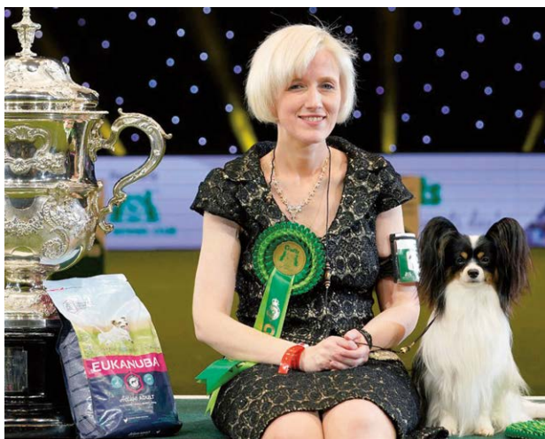
Dit is de BIS 2019, de Papillon 'Planet Waves Forever Young Daydream' uit België, roepnaam Dylan. Het was de eerste keer dat een Papillon de show won.

Vooraf in de jaren negentig is het tentoonstellen van honden weliswaar nog het allerbelangrijkste, maar ook agilitycompetities, flyball, heelwerk to music, obedience, politie- en reddingshonden trekken tienduizenden bezoekers. Crufts beweegt mee met de maatschappelijke veranderingen: 'Discover Dogs' – de vele stands van rasverenigingen – en het 'Good Citizen Dog Scheme' – trainingsprogramma voor hondeneigenaren – spelen in op verantwoordelijk hondenbezit en ook niet-rashonden krijgen de gelegenheid zich te presenteren. Nieuwe competities, zoals 'Friends for Life', over de unieke relaties tussen eigenaren en honden, doen hun intrede. In het nieuwe millennium wordt 'The Health Zone' omgedoopt in 'Breeding for the Future'. Op alle fronten stijgt de aandacht voor gezonde honden, onder andere door een samenwerking tussen Crufts en de 'Animal Health Trust'; dat is een organisatie met veel expertise op het gebied van genetisch onderzoek en erfelijke afwijkingen bij honden. Net als nu in Nederland, krijgen keurmeesters de gelegenheid om honden met ongezone kenmerken uit de showring te verwijderen.