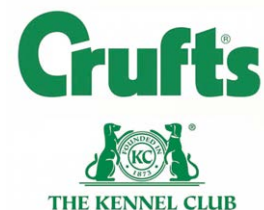
Logo van Crufts. In 1978 wordt de naam Cruft's gewijzigd in Crufts.

In 1886 wordt Cruft benaderd door Kathleen Pelham-Clinton, Duchess of Newcastle, om de organisatie van de Allied Terrier Club Show, in het Royal Aquarium, Westminster, op zich te nemen. Met gevoel voor marketing noemt Cruft het The First Great Show of all kinds of Terriers . Er komen 570 inschrijvingen in 57 klassen.