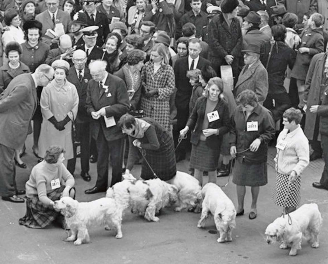
In 1969 bezoekt koningin Elizabeth II Crufts Dog Show. Hierlaat ze zich informeren bij de keuringen van de Engelse Springer Spaniels en Clumber Spaniels.