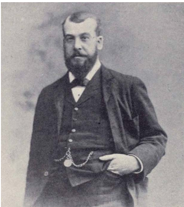
Charles Alfred Cruft in 1902 op dertigjarige leeftijd.

Charles Alfred Cruft wordt geboren in 1852. Hij is niet geïnteresseerd in het juweliersbedrijf van zijn familie, maar gaat werken bij James Spratt's, fabrikant van hondenkoekjes in Holborn. Op zijn reizen door Engeland, Schotland, Frankrijk en de Verenigde Staten, om de befaamde Spratt's dog cakes te promoten en verkopen, bezoekt hij fokkers op landgoederen en grote hondenkennels. Charles brengt het tot algemeen directeur, maar als hij zijn beroep moet invullen, schrijft hij 'show promotor'.