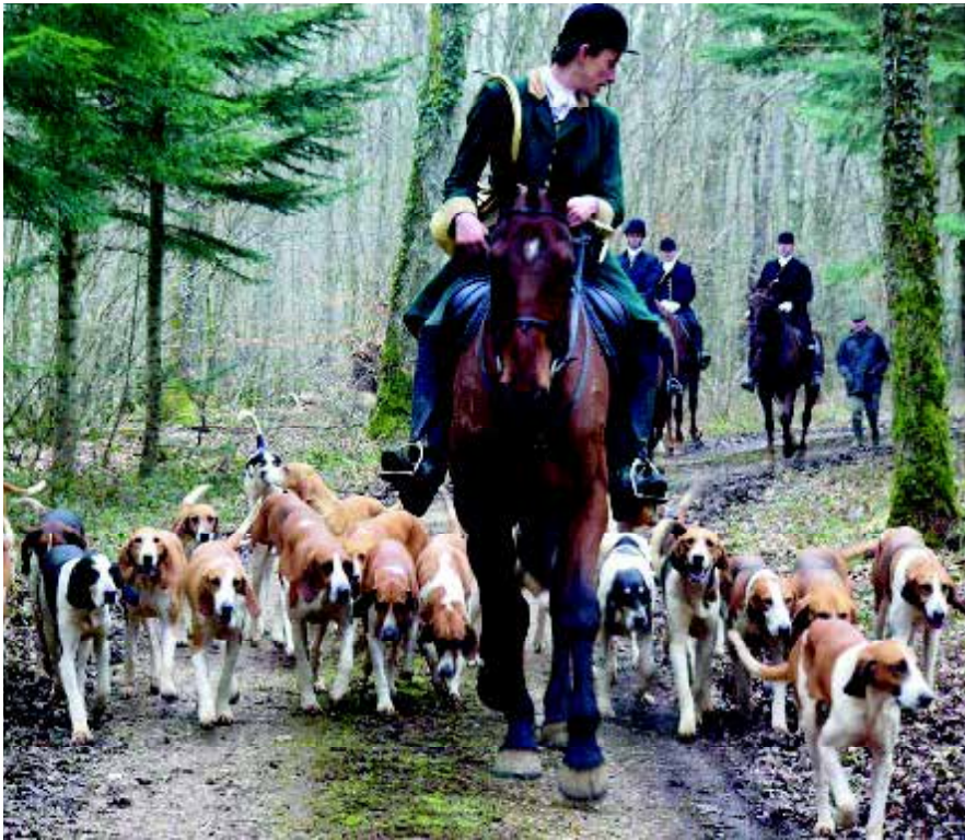
De 'Chasse-à-Courre' is nu nog een kleurig schouwspel met eeuwenoude gebruiken en tradities.