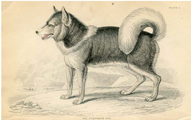
Canadian Eskimo Dog uit "The Naturalist's Library", 1840.

ningen zijn succesvol; niet alleen zijn de mannen in staat om overgebleven populaties te lokaliseren, maar ze starten ook een serieus fokprogramma op. Het resultaat is dat er in 1986 weer CED's worden ingeschreven in het Canadese stamboek. De CED mag dan wel voor uitsterven zijn behoed, maar het blijft verontrustend dat er nu, wereldwijd, slechts circa duizend raszuivere exemplaren zijn. In 2020 meldt de krant Nunatsiaq News dat er vanuit de Canadese rasvereniging, bij monde van president Jason Foucault, druk wordt uitgeoefend op de CKC om de naam Canadian Eskimo Dog te wijzigen in Inuit Qimmiq.