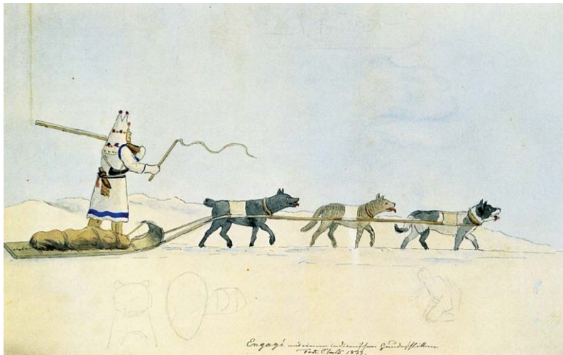
Getekend in 1833 door Maximilian zu Wied-Neuwied (1782-1867).