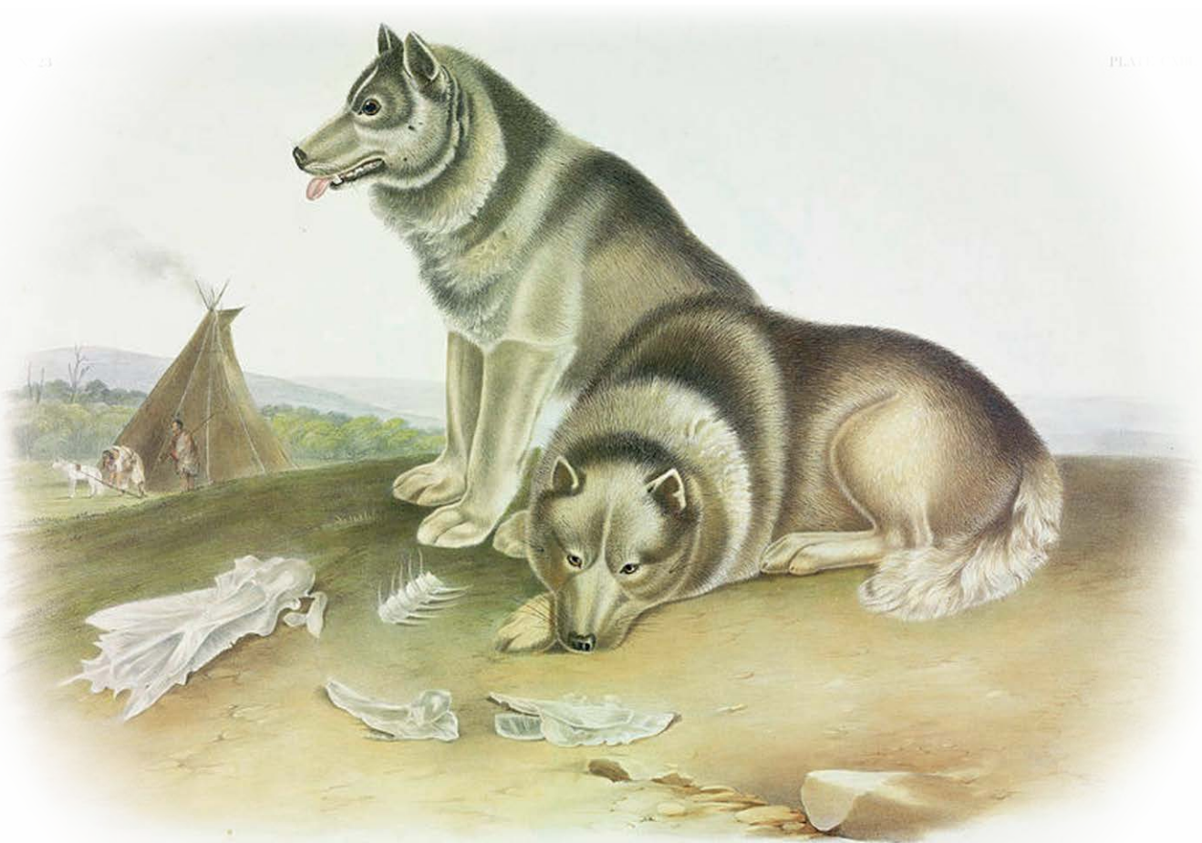
Jean-Jacques Audubon (1785-1851) is een Frans-Amerikaanse ornitholoog, natuuronderzoeker, schilder en illustrator. Hij tekent deze Eskimo Dogs met op de achtergrond een Eskimotent.