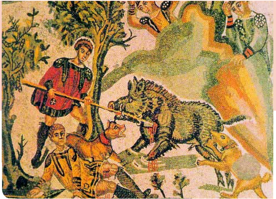
• Jacht op het wilde varken. Mozaïek in de Villa Casale in Piazza Armerina, Sicilië.

Het is onmogelijk om hier alle facetten van dit boek uitvoerig te belichten. Neemt u maar van mij aan dat we te maken hebben met een werk van uitzonderlijke kwaliteit. Het begint met een goed overzicht van de periode vanaf de prehistorie tot de Grieken en Romeinen, gevolgd door een overweldigend aantal teksten, daterend van