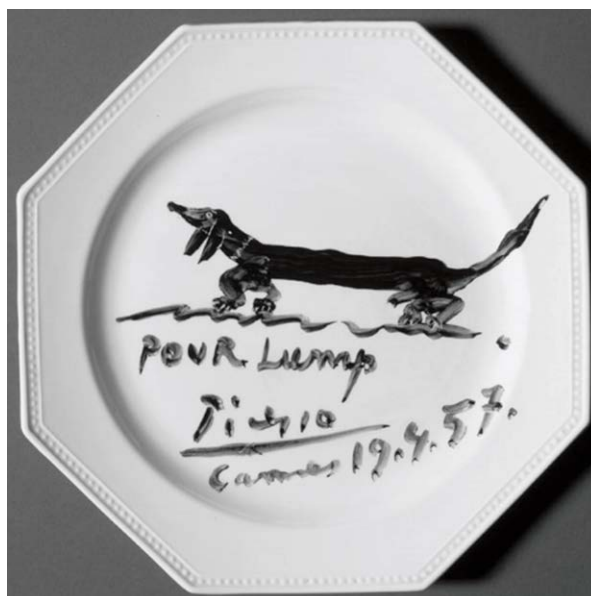
Lump, vereeuwigd op keramiek in de jaren vijftig.

Kunsthistorici schrijven dat Lump het belangrijkste 'hondenmodel' in de kunstgeschiedenis is. David Douglas Duncan schrijft zelfs een boek over de bijzondere relatie tussen Picasso en Lump: Lump, the Dog who ate a Picasso . Men zegt dat Lump de enige van Picasso's honden was die op zijn schoot mocht zitten en door de kunstenaar werd geknuffeld. Een week voordat Picasso overlijdt komt ook voor Lump het einde, in april 1973. Hij bereikt de respectabele leeftijd van 16 jaar.