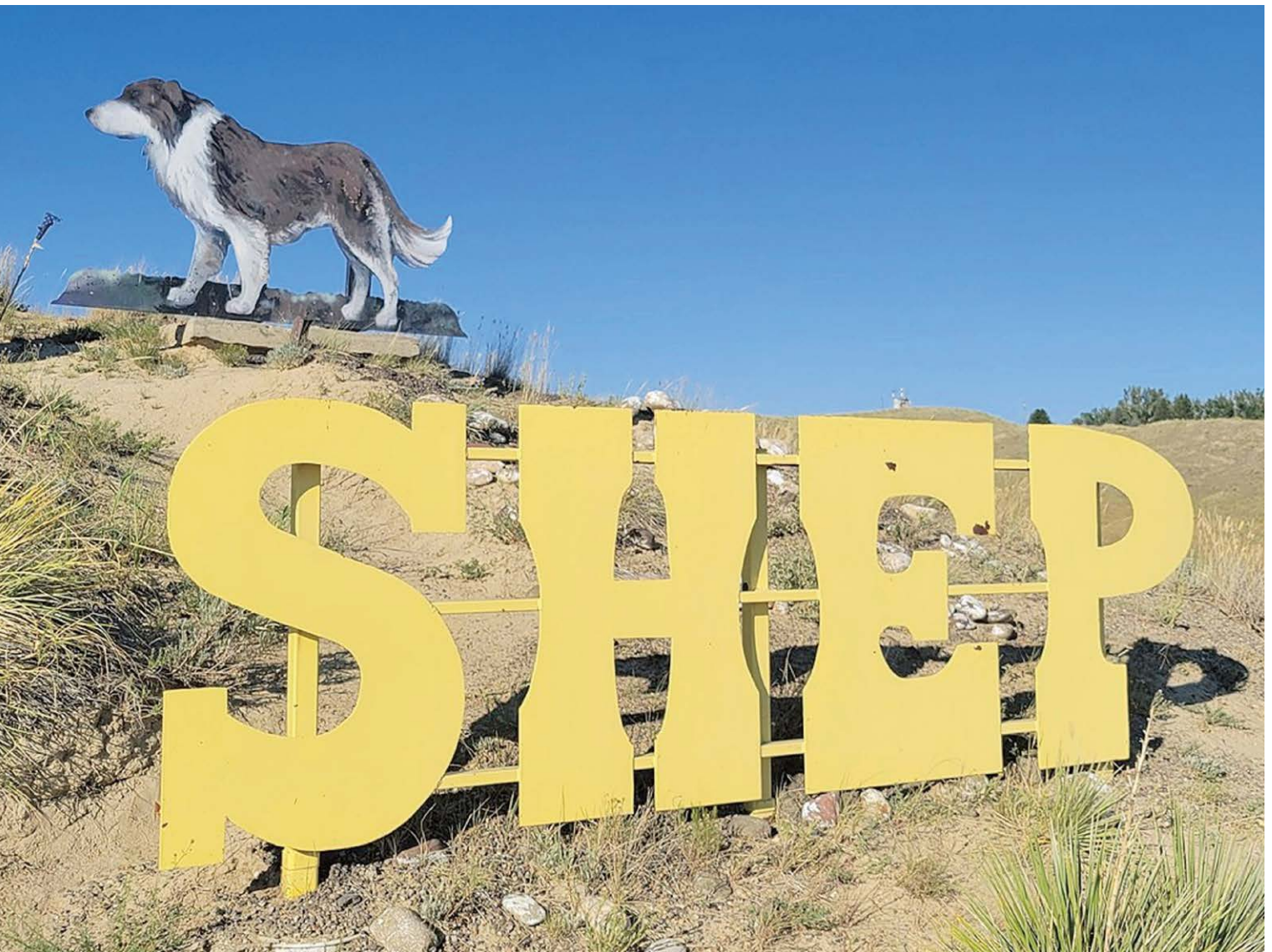
De Great Northern Railroad plaatste een obelisk en een beschilderde houten uitsnede van Shep.