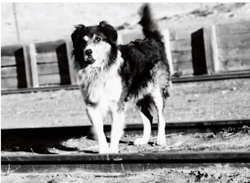
Zo moet Shep op de rails hebben gestaan toen hij in 1942 door een trein werd overreden.

Er zijn verschillende prachtige verhalen over hoe trouw honden kunnen zijn. Ken je het verhaal van Fala? Dat is de Schotse Terrier van president Roosevelt, die altijd op zijn baas bleef wachten en naast diens tombe werd begraven. Mopshond Fortunatus liep 1200 kilometer terug naar zijn baas. En Ruswarp, de 14-jarige Border Collie waakte elf winterse weken bij zijn verongelukte eigenaar. Een ander voorbeeld van een hond die ‘forever faithful’ – eeuwig trouw is, is dat van Shep, de herdershond uit Montana.