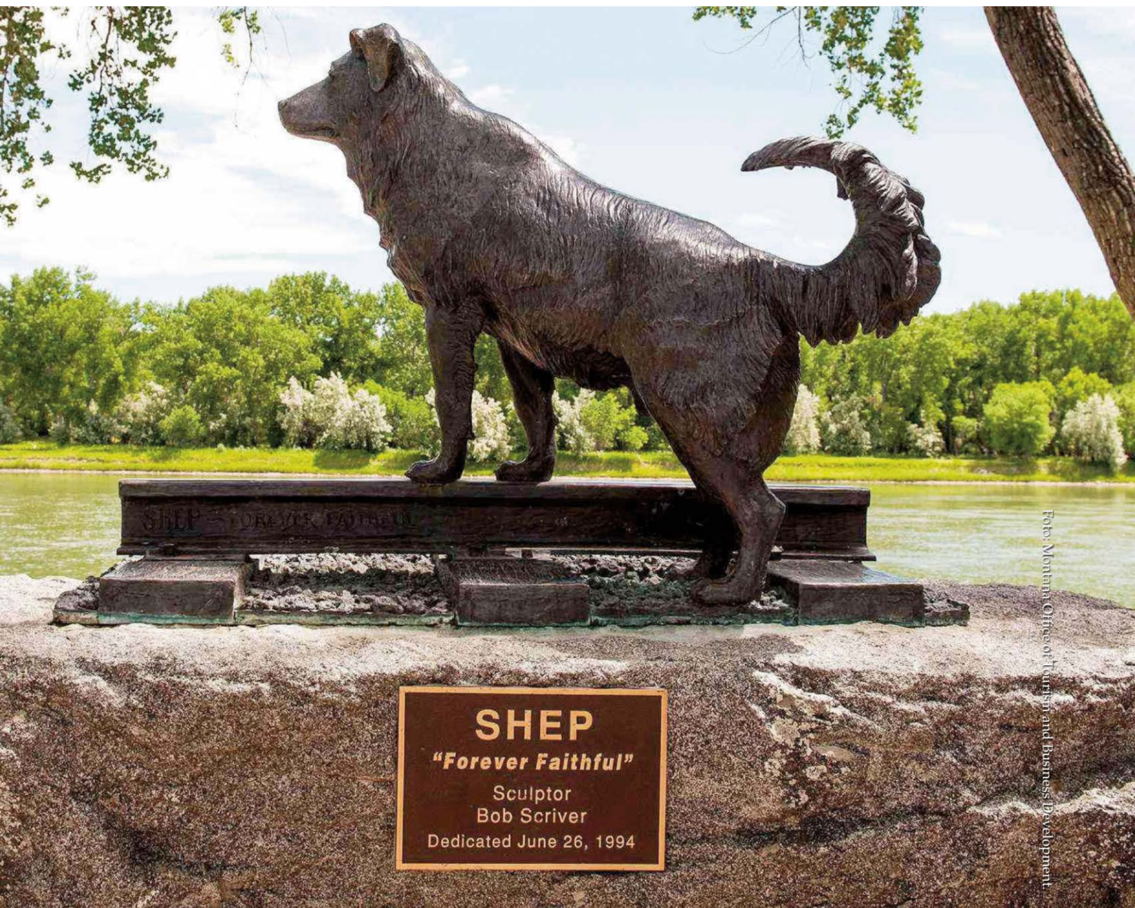
Shep: afwachter met gespitste oren, zijn voorpoten op de rails en uitkijkend op de Missouri.

terug naar zijn verwanten. De hond volgt de kist naar het station, kijkt toe toen deze in de trein wordt geladen en ziet zijn baas vertrekken. Ooggetuigen meldden dat de hond, die leek op een Australian Shepherd of een Border Collie, huilde bij het vertrek van de trein. Daarna komt hij elke dag naar het station en wacht op de vier dagelijkse treinen die in Fort Benton binnenkomen. Het duurt even voordat het stationspersoneel in de gaten krijgt dat de hond daar wacht op de terugkeer van zijn baas. Ze geven hem de naam Shep, toepasselijk voor een herdershond, zorgen voor zijn natje en droogje en laten hem in en rond het station slapen. Het duurt niet lang voordat iedereen die per trein van en naar Fort Benton reist, de trouwe herdershond