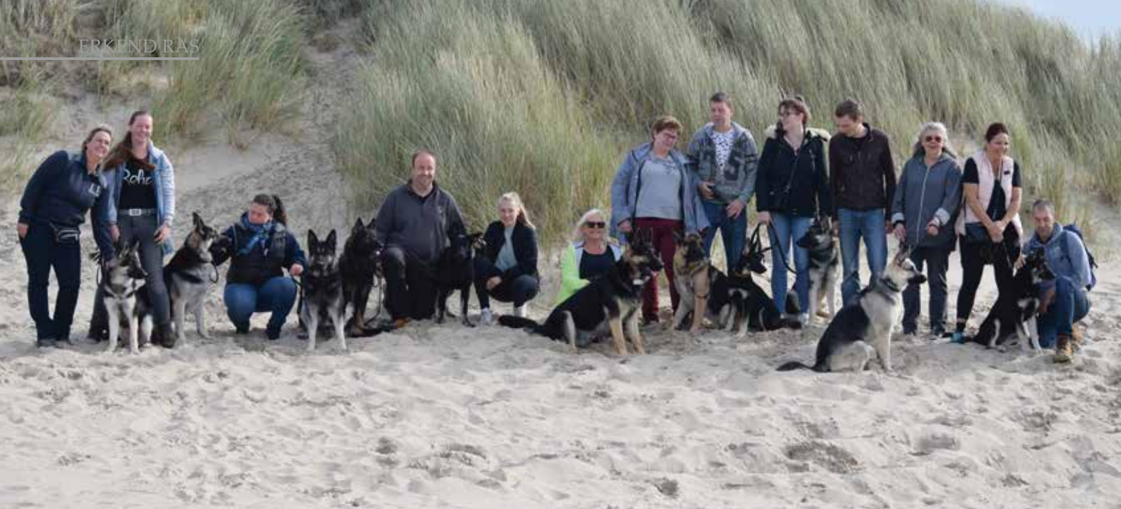
Een groep liefhebbers met hun VEO's. Er zijn inmiddels zo'n veertig honden in Nederland.