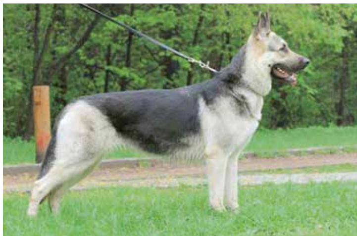
Een volwassen VEO. Let op de kaarsrechte ruglijn!

Volgens de berichten is er bij het creëren van de Vostochno-Evropeyskaya Ovcharka slechts af en toe een lokale waakhond doorheen gefokt.