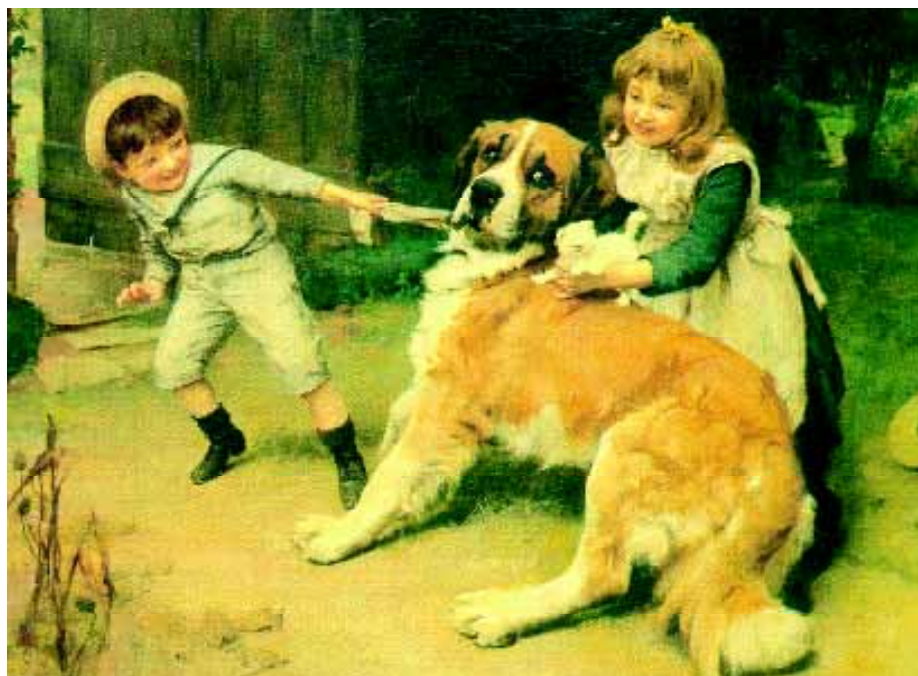
Elsley's eerste schilderij van een Sint Bernard is getiteld 'Victims', dat in 1891 in de Royal Academy wordt tentoongesteld.

De Eerste Wereldoorlog heeft een dramatisch effect op zijn productiviteit. Hij werkt part time voor de munitie industrie, waar hij zich bezighoudt met precisiewerk bij het maken van viziers. Elsley is erg bijziend en dit werk is weliswaar uitstekend voor hem geschikt, maar het legt een te zware druk op zijn ogen, en schilderen wordt steeds moeilijker. In de oorlogsjaren maakt hij nog slechts een paar schilderijen, maar in 1927 exposeert hij toch weer in de Royal Academy. In 1931 maakt hij zijn laatste schilderij en daarna legt hij