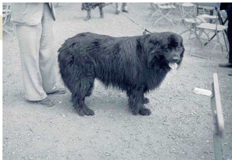
• Muskwas Gody, een in 1934 geboren zwarte Newfoundlander teef.