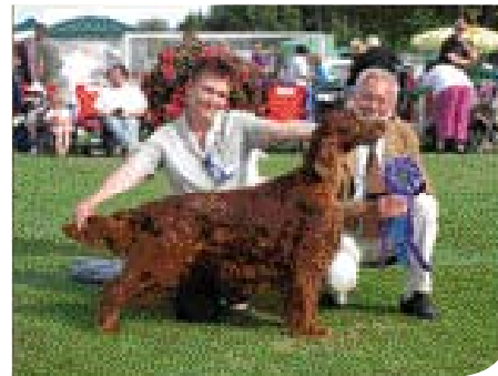
• Ierse Setter uit de kennel 'Dubliner' op een buitententoonstelling in Zweden, meer dan zeventig jaar later..

In de jaren 1799-1805 publiceert Sydenham Edwards in Engeland zijn 'Cynographia Britannica', waarin sublieme gravures staan van tientallen hondensrassen. Ook de drie setter variëteiten zijn present: Ierse Setter