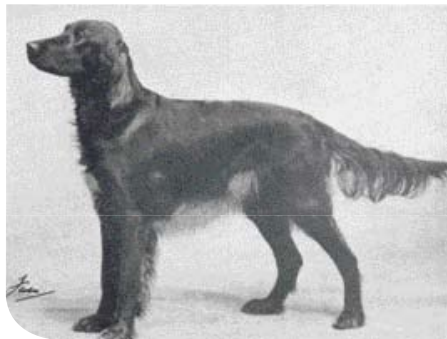
• Beula of Gadeland gefotografeerd door de bekende hondenfotograaf Thomas Fall vóór haar vertrek naar Nederland in 1936.

Deze Gunther levert een succesvolle bijdrage aan de bekende 'O'Cantrim' kennel van mejuffrouw G.M.S. Pols in Hilversum. En daarmee is Beula