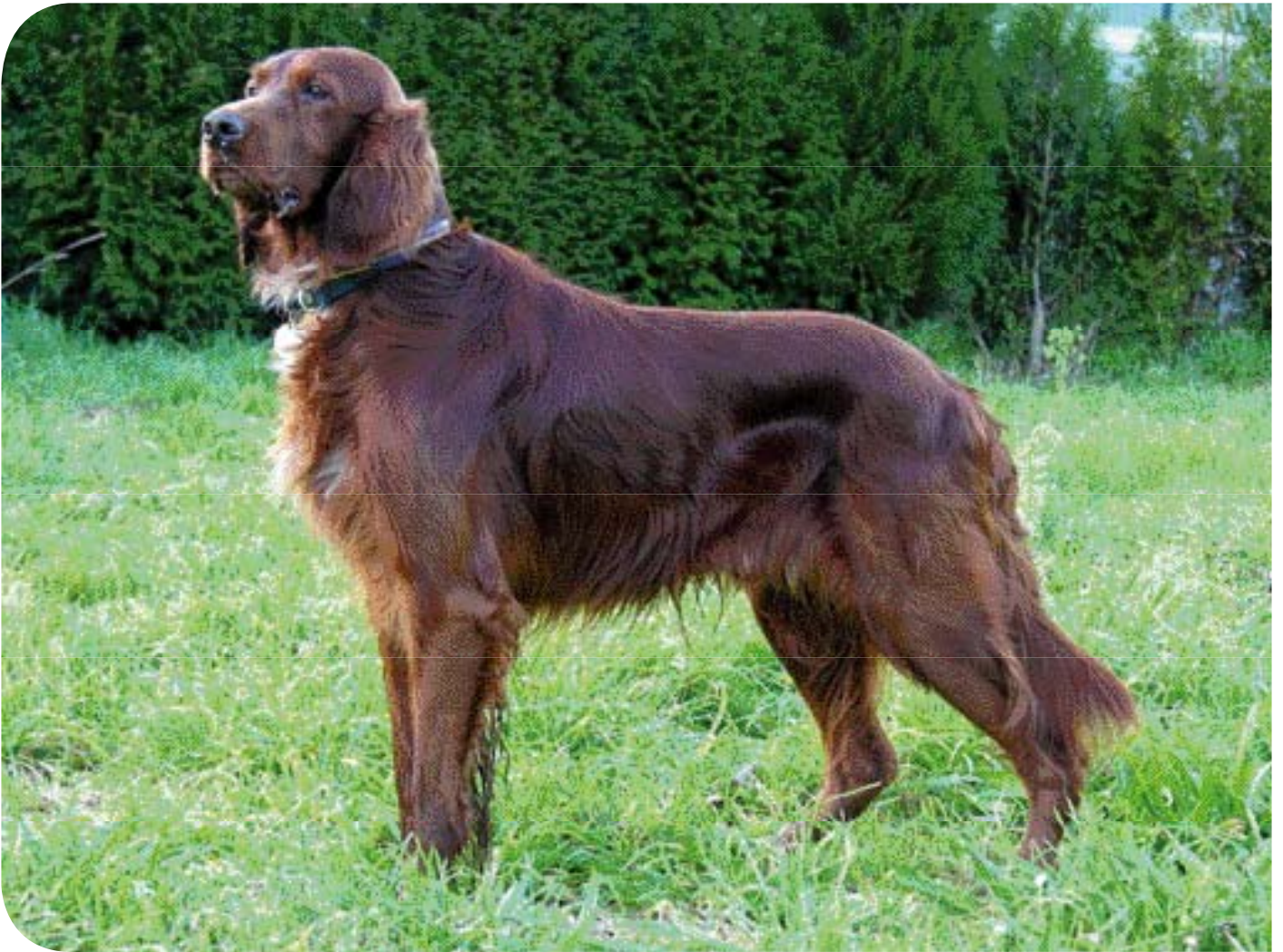
• De Ierse Setter anno nu. Ook deze hond heeft een kleine hoeveelheid witte haren op de borst.