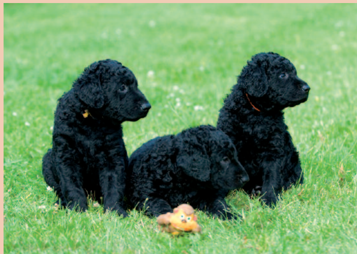
Het grote voordeel van een rashondenpup is dat het vooraf duidelijk is hoe de hond er, in grote lijnen, als volwassen hond gaat uit zien.

De aanschaf van een hond brengt een groot aantal verantwoordelijkheden met zich mee. Jaar in, jaar uit moet er iemand beschikbaar zijn om voor de hond te zorgen; niet alleen een pup heeft aandacht nodig, ook honden die oud worden kunnen extra verzorging nodig hebben. Behalve de aanschafkosten zijn er jaarlijks dierenartskosten (entingen etc.) en de kosten voor andere voorzieningen, zoals de voeding, huisvesting, eventueel trimmen, gehoorzaamheids cursussen, pensionkosten, enz. Het zindelijk maken, socialiseren en opvoeden van een pup en opgroeiende hond gaan niet of nauwelijks samen met full time werken. Ook daar zullen dus keuzes moeten worden gemaakt of oplossingen moeten worden gevonden. Kinderen vinden de komst van een pup in eerste instantie geweldig en willen er van