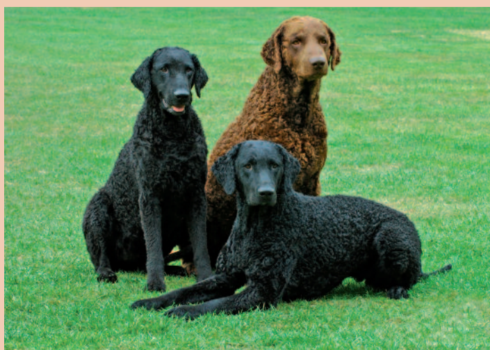
Stoer, elegant en aristocratisch.