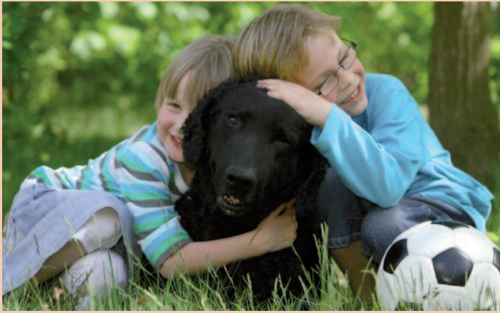
Curly Coated Retrievers zijn kindervrienden van nature.

alles voor en mee doen. Maar: de opvoeding van een pup kan niet aan kinderen worden overgelaten en als het nieuwtje eraf is, komt de zorg op de ouders neer. Een rashond brengt uiteraard ook veel plezier; hij of zij kan een kameraad voor het leven zijn, een fijne vriend en een trouwe metgezel.