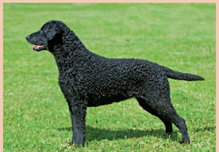
De Curly Coated Retriever is een lid van de Retrieverfamilie en is de grootste qua formaat.

Zijn naam zegt het al: retrieven – het geschoten wild ophalen en terugbrengen naar de jager – is het oorspronkelijke werk van deze jachthond. Curly Coated verwijst naar zijn typische vacht, die bestaat uit stevige, kleine krulletjes. Curly Coated Retrievers zijn leden van de Retriever familie, waar ook de Golden Retriever, Labrador Retriever, Flatcoated Retriever, Chesapeake Bay Retriever en de Nova Scotia Duck Tolling Retriever bij horen. Allemaal honden die in de landen van hun