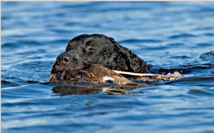
Met zwemmen doet de eigenaar deze hond een heel groot plezier.

een hondententoonstelling en actieve bazen kunnen een aantal activiteiten combineren, want Curly's hebben voldoende energie. Kortom, een sportieve baas wordt op prijs gesteld. Kiest u voor één van de hondensporten, kijk dan op www.cynophilia.nl of op de site www.raadvanbeheer.nl