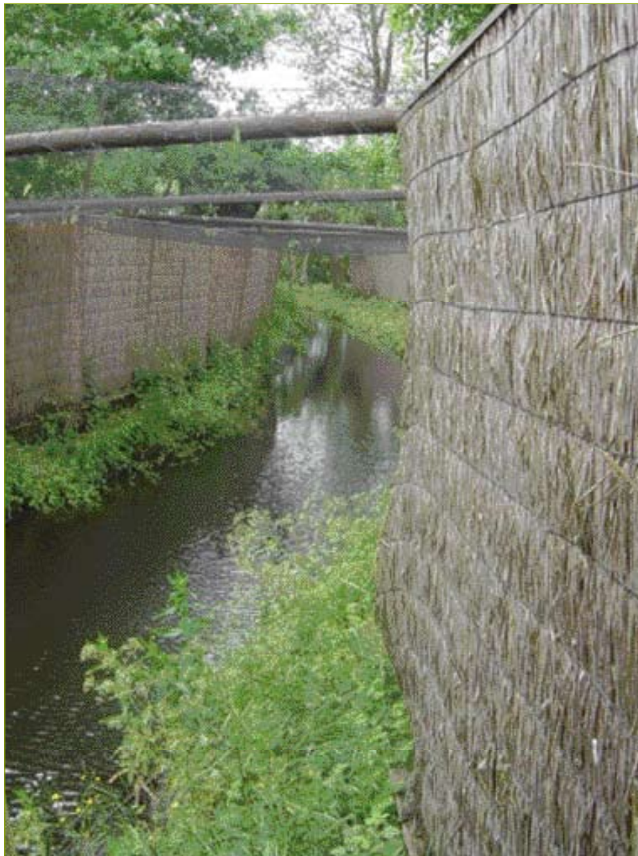
• De eendenkooi in Achersloot. De rietschermen langs de vangarm zijn hier goed te zien.

Niet voorstaan, niet opstoten, niet apporteren of achtervolgen. Nee, een jachthondje als lokvogel en kleine paniekzaaier.