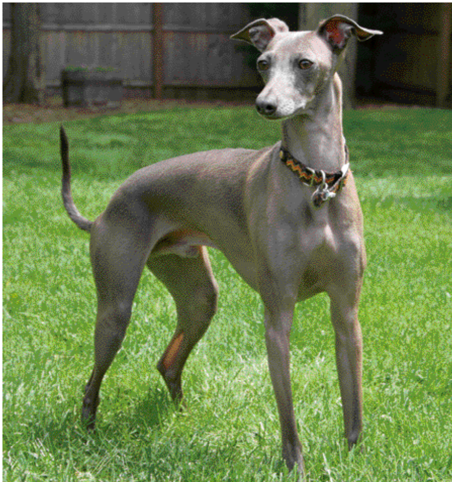
Het Italiaanse Windhondje is een van de vele Italiaanse rassen.

Het stamboek bevat ondertussen al 8.636 geregistreerde honden. In 1950 vindt een internationaal 'sporting event' voor Engelse Pointers plaats. In die jaren speelt de kynologie ook een technische en wetenschappelijke rol en worden er op universitair niveau cursussen en testen georganiseerd, iets dat tot op de dag van vandaag gebeurt.