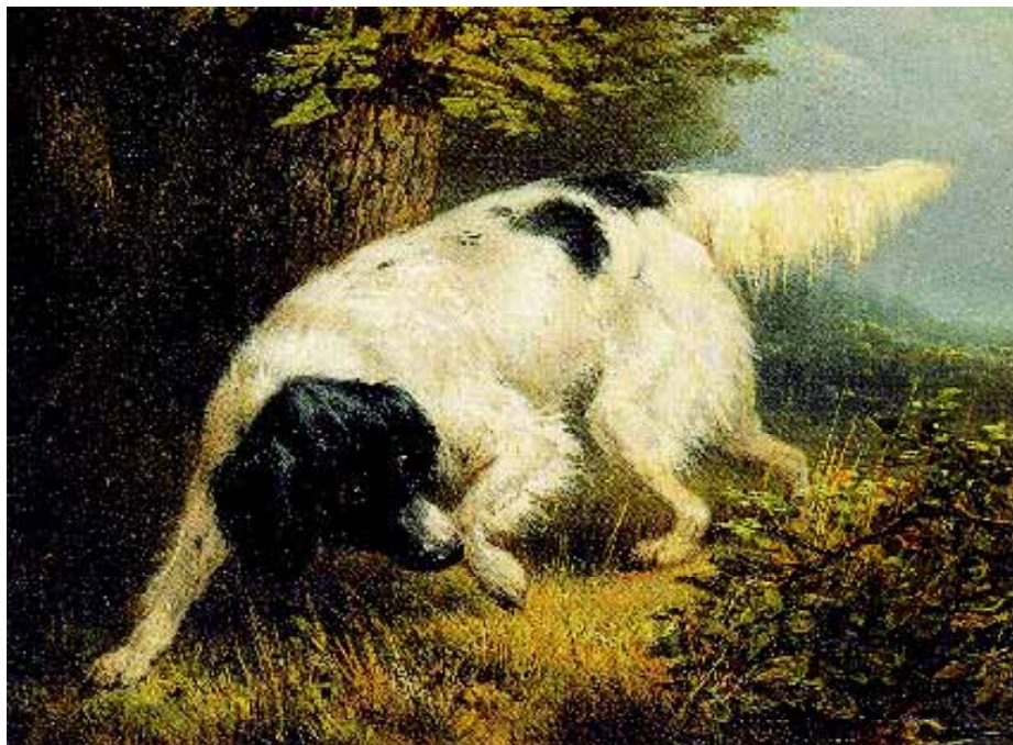
• 'Stabij met houtsnip', een schilderij van Henriëtte Ronner-Knip (1821-1909). Zij is gespecialiseerd in romantische schilderijen met dieren.

Tijdens de Winnershow op 26 en 27 november in de Amsterdamse RAI worden de Stabij- en Wetterhounen op zondag 27 november gekeurd. Maar u kunt op de beide Winnerdagen uitvoerig kennismaken met deze twee interessante rassen in het 'hondendorp' van de Winner. Meer informatie vindt u op de website: www.winnershow.nl