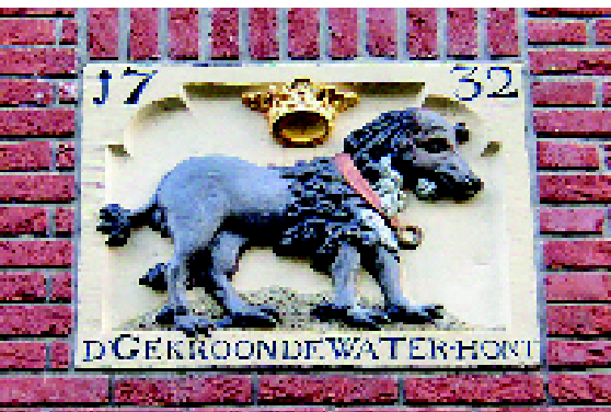
• Gevelsteen uit 1732 in de Nieuwe Leliestraat in Amsterdam: 'D Gekroonde Water-hont'.

daarop, en ook het forse en krachtige hoofd doen veronderstellen dat er in een ver verleden dogachtige voorouders moeten zijn geweest.