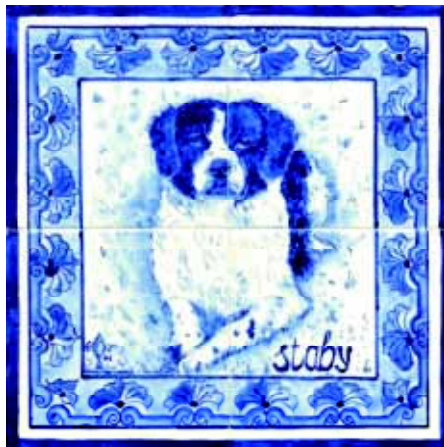
• Een tegel met de afbeelding van een Stabij.

In de zestiende eeuw is jagen nog voorbehouden aan de hogere standen, maar in de zeventiende eeuw krijgen de boeren dit recht ook. Het is vrijwel zeker dat de Stabij rond 1800 al in Friesland voorkomt, het meest in de Wouden, in het oosten en zuidoosten van de provincie. Hij wordt dan beschreven als een langharige, zwarte hond die op zijn terrein ongedierte vangt. Aan het einde van de negentiende eeuw wordt de Stabij nauwijsbaar ingezet bij het vangen van mollen en bunzings. De vrij arme bevolking kan een kleine bijverdienste door de verkoop van de vellen goed gebruiken, zeker in de crisisjaren van de vorige eeuw. Friese mollenvaarders werken door heel Nederland en niet zelden fietst hij met z'n hond achterop in een mandje, naar de klanten die last van mollen hebben. Als voor het mollenvangen een vergunning nodig wordt, blijft men volop illegaal jagen; controle is immers bijna onmogelijk. Ook de bunzingjagers maken gebruik van 'Bijke', een woord dat in die tijd eigenlijk synoniem is met mollenhond. De Stabij is daarmee typisch de jachthond van 'de kleine man'. Aan het begin van de twintigste eeuw komen we niet alleen 'Bijke'