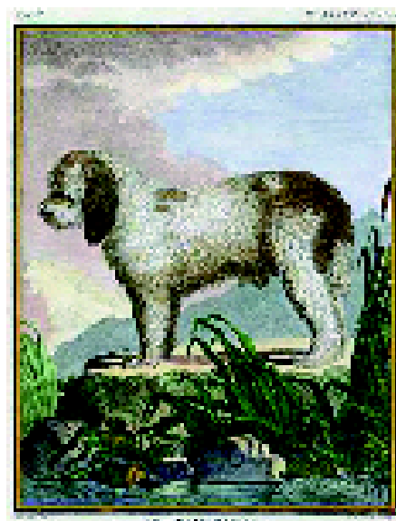
• In het beroemde werk 'Histoire naturelle' van de Fransman de Comte du Buffon (1707-1788) staat deze tekening van 'Le Grand Barbet'. Een oeroude verwantschap met de Wetterhoun is niet uitgesloten.

De Wetterhoun heeft namelijk iets dat deze rassen niet bezitten: dogachtige kenmerken. De grove bouw en het zware beenwerk wijzen