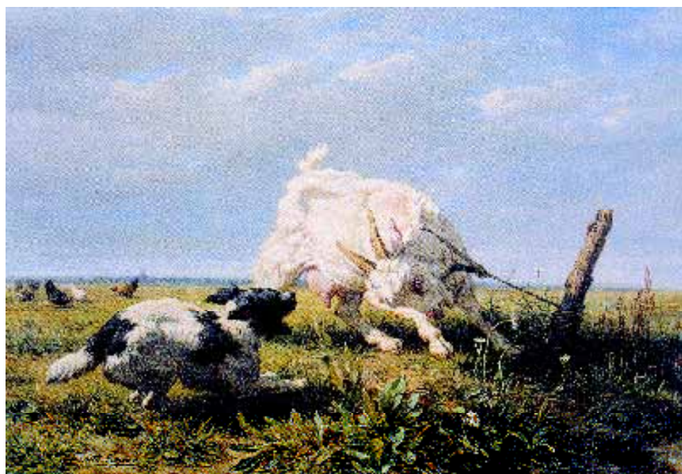
• Een in 1870 gemaakt schilderij van Henriëtte Ronner-Knip, getiteld 'Hond en geit'. De hond is van het Stabij type.

maar daarmee weten nog niets over zijn verre verleden. Hoe dan ook, feit is dat er in de zestiende en de zeventiende eeuw veel schilderijen worden gemaakt waarop het kleine zwart-witte jachthondje is afgebeeld.