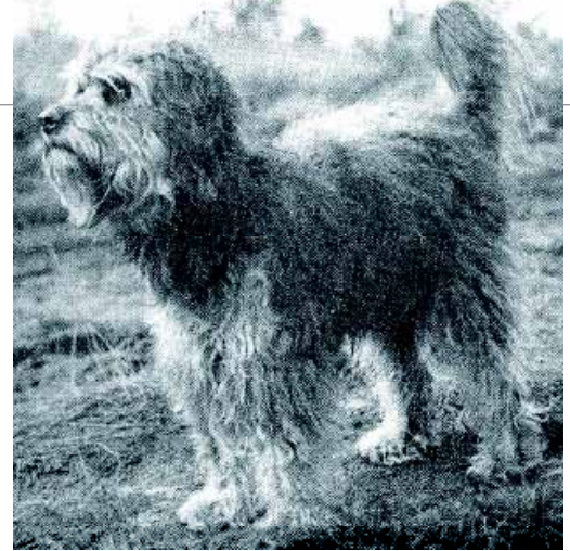
♦ De reu 'Pluis', één van de stamvaders van de huidige Schapendoes.

Teven worden meestal twee keer per jaar gedurende drie weken loops. Wie loopsheid lastig vindt, moet liever niet voor een teef kiezen. Overleg de keuze voor een reu of een teef, uw (woon) situatie en andere wensen met de fokker van uw keuze.