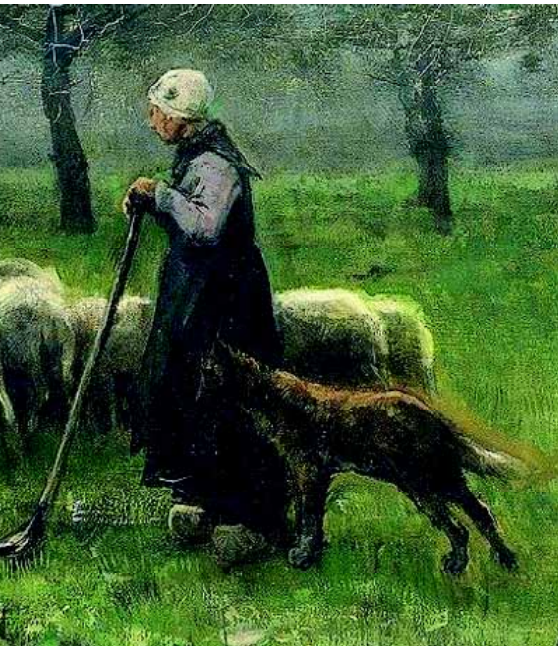
• 'Herderin met schapen en hond', detail uit een schilderij van Anton Mauve (1838-1888), dat is gesitueerd op de heide in Laren.

rusten niet voordat de kudde veilig bij de schaapskooi is aangekomen. Bij het hoeden zal de hond slechts bij hoge uitzondering een schaap, bij de wol, vastpakken, maar doorbijten mag niet! De schapen, op hun beurt, zijn niet bang voor de hond, maar ze tonen wel ontzag voor hem. Net als bij de Drentsche Patrijshond, zijn er bij dit ras ook diverse populaties geweest, maar bij dit ras verspreid over het hele land. Degene die het beste werken bij schapen worden veelal voor de fokkerij ingezet. Behalve voor legale taken, wordt deze herdershond door zijn baas soms ook gebruikt bij het stropen en als we oude foto's en ansichten bekijken, dan zien we dat hij ook onder de hondenkar wordt ingezet. Ten slotte wordt van hem verwacht dat hij het erf bewaakt. Hij is met recht een manusje-van-alles en zoveel taken voor één soort hond betekent dat er optimaal gebruik wordt gemaakt van zijn vaardigheden en dat een intelligente herdershond veel waard is.