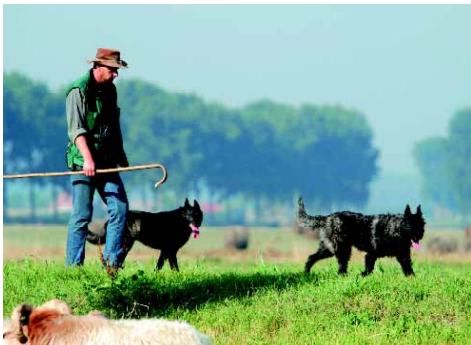
• Ook vandaag de dag werkt de Hollandse Herder nog bij de kudde.

Het échte werk, het hoeden bij de schaapskudden, is er voor de Hollandse Herdershond nauwelijks meer en bovendien heeft hij 'concurrentie' gekregen van de Border Collie. Daarentegen zijn de mogelijkheden om met deze hond aan hondensporten te doen legio. Bijvoorbeeld Gedrag en Gehoorzaamheid, agility, flyball en speuren, maar ze kunnen ook worden opgeleid tot politiehond, reddingshond, drugshond en explosievenhond. Die veelzijdigheid is één van de aantrekkelijke kanten van dit ras. Overal in Nederland is gelegenheid om met trainingen de Hollandse Herder voor verveling te behoeden. Inschrijven op tentoonstellingen en clubmatches kan natuurlijk ook. ◀