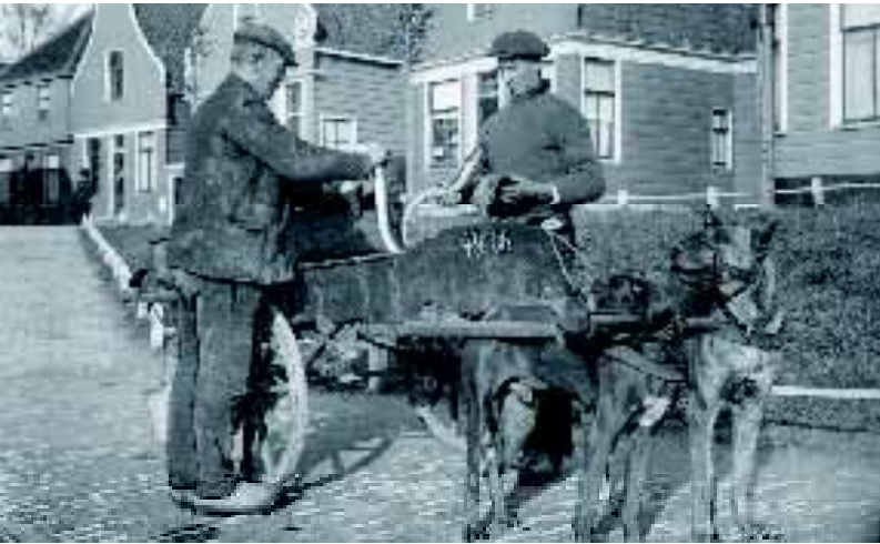
• Palingverkoop vanuit een hondenkar, Zaandam, 1913. De hond rechts is herkenbaar als Hollandse Herdershond, bij voorbeeld aan zijn rechtopstaande oren en gestroomde vacht.

gekozen voor andere bezigheden met de hond. De Hollandse Herdershond is in principe een vriendelijk huishond, die goed in een gezin past, mits hem duidelijk is wie de roedelleider is en wat er van hem verwacht wordt. Hun ingebakken aard om actief te willen zijn, stelt wel eisen aan de eigenaar. Een Hollander is niet gelukkig met een lui leven; hij leert