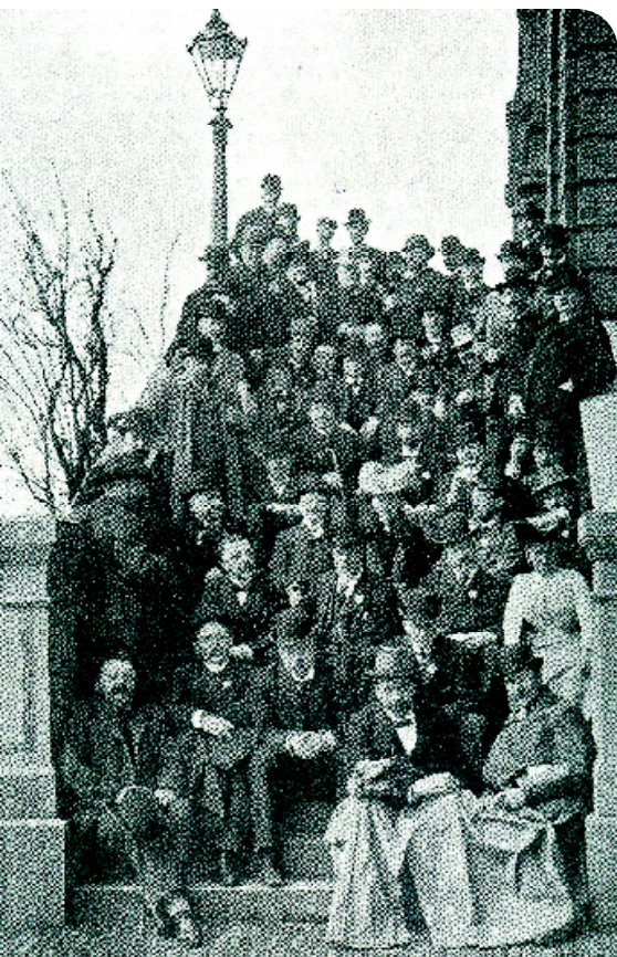
• Foto gemaakt ter herinnering aan de tentoonstelling van 'Cynophilia' in 1903.

De organisatie gebeurt volgens de voorschriften van het Kynologisch Reglement van de Raad van Beheer.