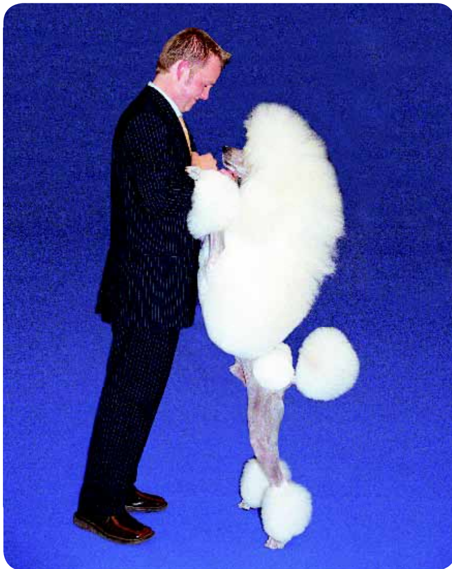
• De Best in Show op de Wereld Winner 2002: Int. Ch. 'Topscore Contradiction'.