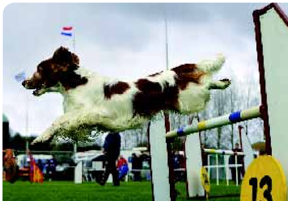
♦ Agility, in goed Nederlands behendigheid, is een onderdeel van het takenpakket van 'Cynophilia'.

In 2010 is, op voorstel van een werkgroep ingesteld door de Raad van Beheer, een voorstel gedaan aan de bij de Raad van Beheer aangesloten verenigingen om de kynologische structuur in Nederland drastisch te wijzigen. 'Cynophilia' zou in dit voorstel buitenspel worden gezet, maar tijdens deze ALV is dit voorstel, door het kordate handelen van 'Cynophilia', niet behandeld. Daarmee was het van tafel voor verdere formele besluitvorming door deze vergadering. Een ruime meerderheid van de verenigingen steunt de Koninklijke Nederlandse Kennel Club 'Cynophilia' en geeft hiermee aan dat 'Cynophilia' zeker een belangrijke rol van betekenis speelt in de Nederlandse georganiseerde kynologie. ◀