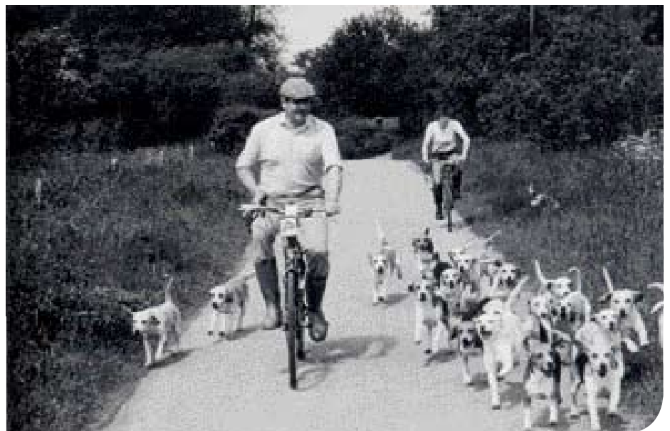
• In de zomer wordt de meute aan de fiets getraind. (Uit: J.C. Jeremy Hobson, Beagling, 1987).

Engeland en Ierland kennen enkele Beagle packs met een lange en rijke historie, zoals de Royal Rock Beagle meute, die van 1845 dateert. De grondlegger, Colonel A. Thompson, begint met zes honden en beschrijft