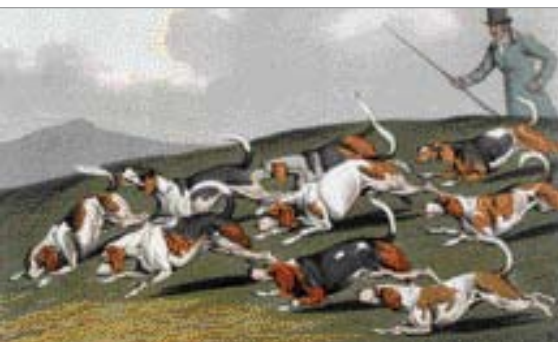
♦ Beagling, getekend door Henry Alken (1785-1851).

van jachtpaarden en -geweren. Beagling is ook een aantrekkelijke sport voor oude(re) vossenjagers, die niet meer zo gemakkelijk hun paarden bestijgen en over hindernissen springen, maar die toch willen blijven genieten van jacht, honden, natuur en jachtvrienden. Dat staat al te lezen in 'Sportman's Cabinet' uit 1803: een sport voor heren die te oud of te gebrekkig zijn voor een ander tijdverdrijf.