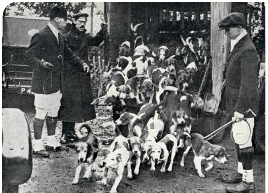
• De aankomst bij de meet van het West Surrey and Horsell Beagle Pack. Foto uit de jaren dertig van de vorige eeuw.