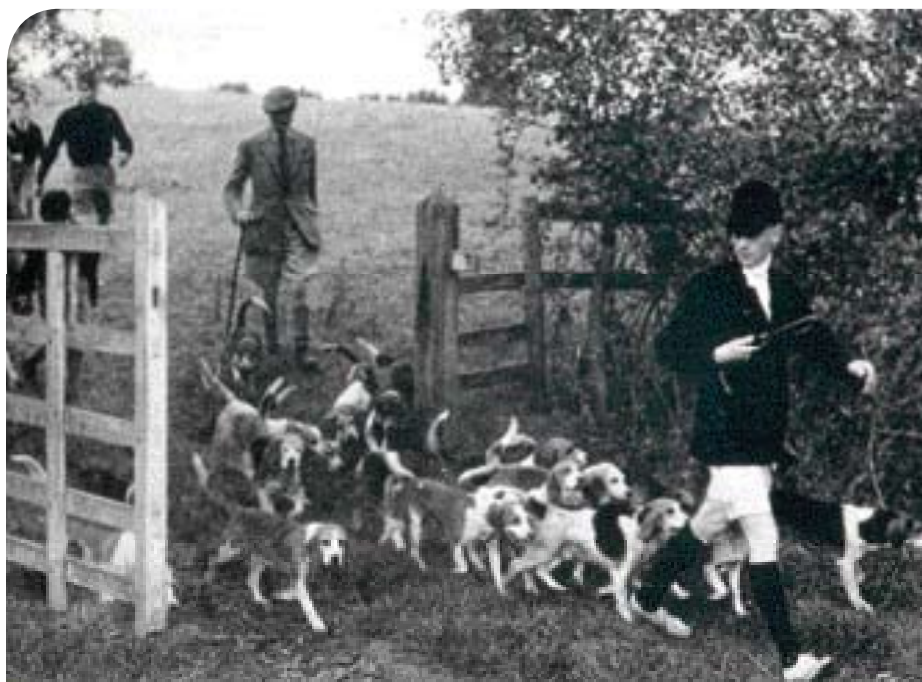
• Een hek in het jachtterrein is een goede gelegenheid om de honden te tellen. (Uit: J. Ivester Lloyd, Beagling , 1954)

follower bij Beagling is. Zij noemt haar honden 'singing beagles', vanwege het melodieuze geluid dat ze