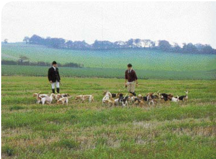
• De kill, vroeger het doden van de buit, nu een beloning voor de honden bij het einde van het geurspoor. (Foto: Richard Hedger).

bijvoorbeeld de 'full cry', het onder luid geblaf volgen van het zojuist opgevangen spoor. Soms kent een meute nog een 'field master', die verantwoordelijk is voor de gedragingen in het veld. Omdat Beagles behoorlijke snelheden kunnen ontwikkelen, moeten deelnemers over een goede conditie beschikken, zeker als de jacht over oneffen terrein gaat. De jacht wordt besloten met de 'kill', vroeger het vangen en doden van de buit, nu het in ontvangst nemen van een beloning voor de honden, meestal in de vorm van vlees. Wapengebruik is taboe bij Beagling; de honden worden geacht het haas of konijn te doden.