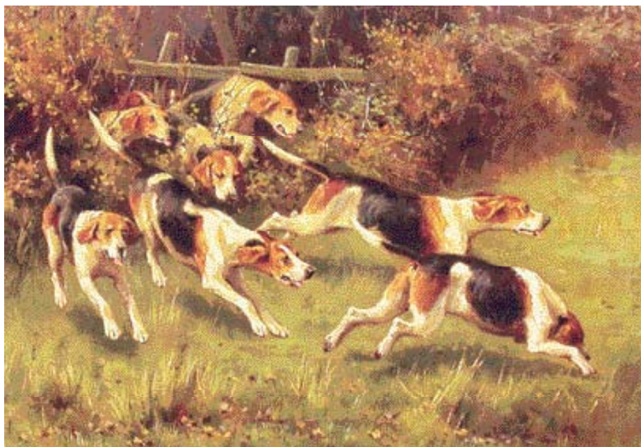
♦ 'Full cry', een schilderij met Beagles van Alfred Duke, een Engelse schilder die werkt eind negentiende en begin twintigste eeuw.

siteiten (o.a. Eton, Christ Church, Malborough en Oxford) en zelfs legerregimenten eigen meutes Beagles bezitten. Echter, en dit in tegenstelling tot de vossenjacht, Beagling is niet uitsluitend een sport voor 'the rich and famous'. Er zijn packs die beschikken over de benodigde functionarissen, zoals een huntsman of een kennelman. Packs waarvan de jagers elkaar ontmoeten (de meet) bij het een of andere landhuis of een pub en traditionele,