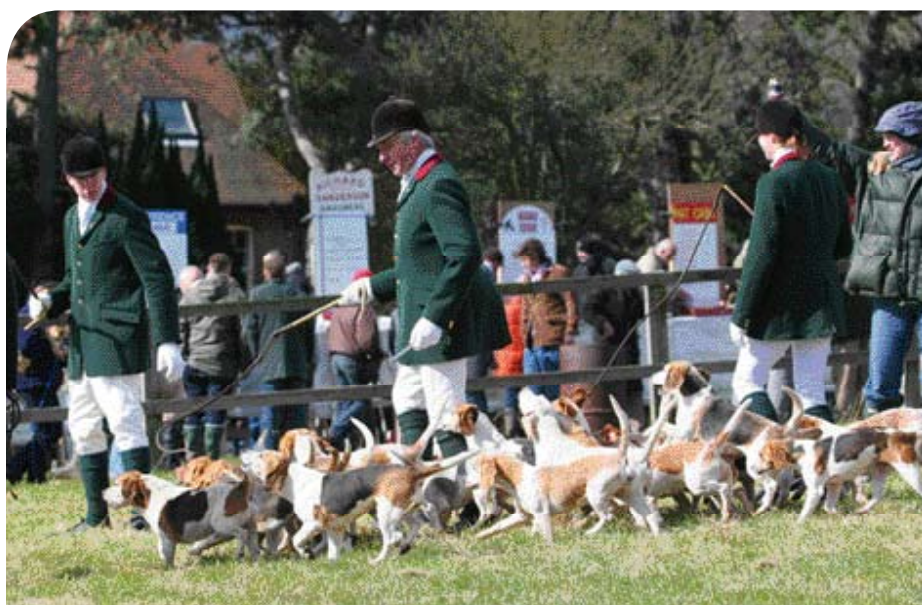
♦ De Pipewell Foot Beagles tijdens een demonstratie op het Festival of Country Life in Lamport Hall (Northamptonshire), in mei 2010. (Fotograaf onbekend).

Mevrouw Ottoline Baronesse van der Borch tot Verwolde – een bekende Beagle fokster – schrijft in december 1988 in Onze Hond: De meute werkt niet voor hun baas, zij werken niet voor de eer, zij werken samen om gezamenlijk het wild te achtervolgen . En dat nu is precies de kern van Beagling. ◀