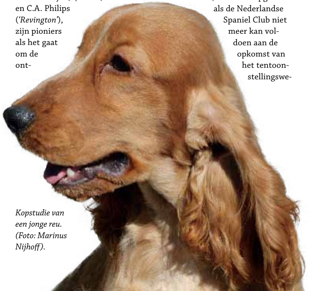
Kopstudie van een jonge reu.

Een ander bekend kynologisch echtpaar dat in de jaren twintig een stempel drukt op de Cocker Spaniel wereld, is baron en baronesse Tindal ('Negro'). Zij zijn, net als de Van Herwaardens, betrokken bij de oprichting (1926) van de Club voor Spaniels en Wachtelhonden, die wordt opgericht als de Nederlandse Spaniel Club niet meer kan voldoen aan de opkomst van het tentoonstellingswe-