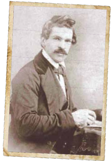
Carl Christian Heinrich Nahl (1818-1878), die zich later Charles Nahl of Karl Nahl noemt. Hij is geboren in de Duitse stad Kassel en stamt uit een beroemde kunstenaarsfamilie.

De maker van dit schilderij is Carl Christian Heinrich Nahl (1818-1878) die zich later Charles Nahl of Karl Nahl noemt. Hij is geboren in de Duitse stad Kassel en op zijn twaalfde is hij al een zeer verdienstelijk schilder met waterverf. Nahl stamt uit een beroemde kunstenaarsfamilie en krijgt zijn opleiding aan de Kunsthochschule in Kassel. Omdat hij ontevreden is over de politieke situatie in Hessen, gaat hij in 1846 naar Parijs, waar hij studeert met Hippolyte Delaroche en Emile Vernet en in de Salon de Paris exposeert. Tijdens de Februarirevolutie van 1848 verhuist Nahl met zijn moeder (zijn ouders zijn in 1826 gescheiden), halfbroer en andere familieleden naar Brooklyn, New York. Hij verblijft maar kort in Brooklyn; het is de tijd van de 'gold rush' – de goudkoorts – en ook Nahl zoekt daarin zijn geluk. In 1849 arriveert hij in Nevada City (Californië) en strijkt ten slotte neer bij Deer Creek in Rough and Ready (Nevada Coun-