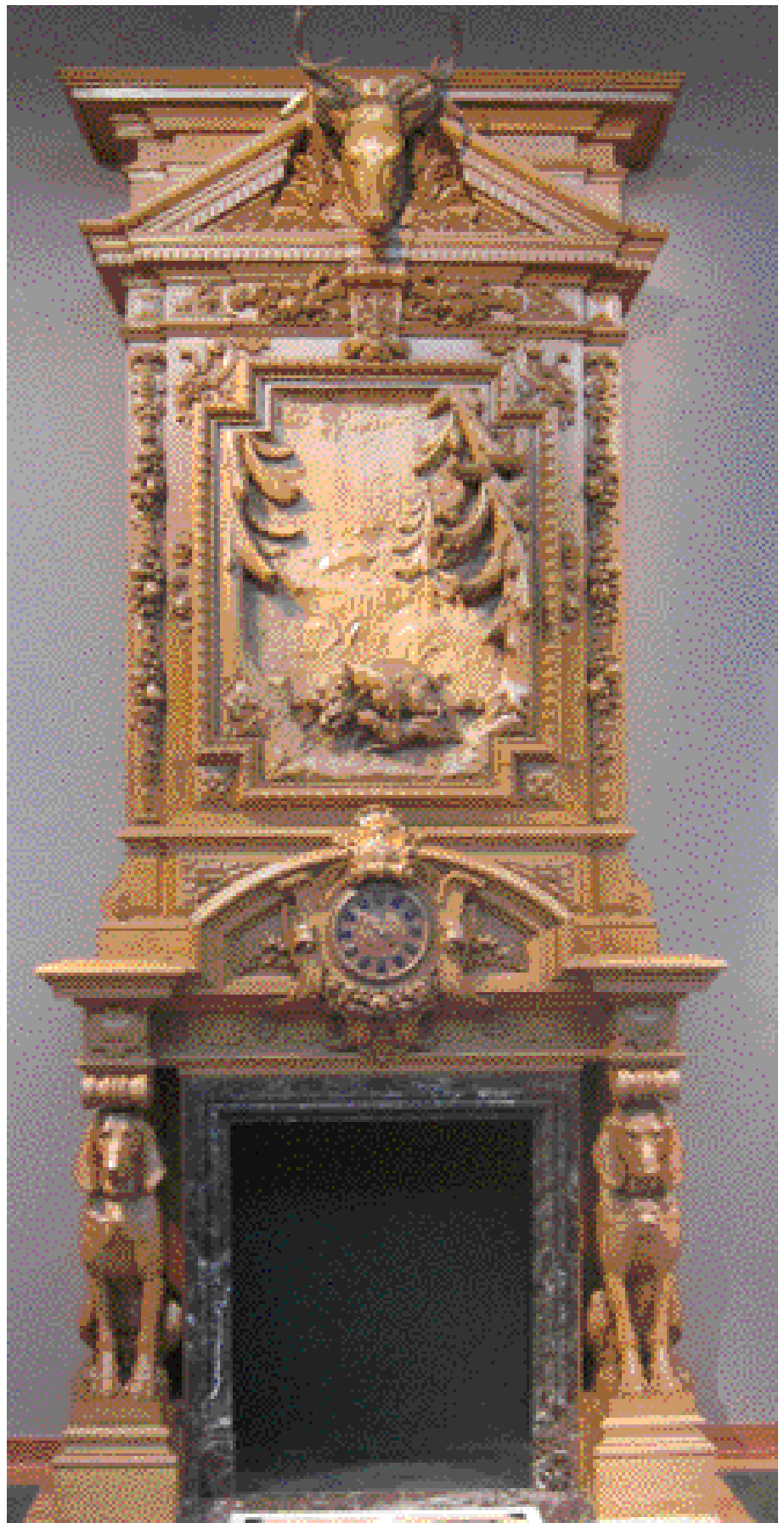
Van museale betekenis is de houten schoorsteenmantel in de eetkamer van 'Thurlow Lodge', die wordt gedragen door twee in hout uitgesneden jachthonden.