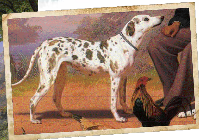
Detail van de staande Dalmatische Hond.

De zittende man, die een soort 'bedienden uniform' draagt, kijkt recht 'in de lens', alsof hij wordt gefotografeerd. Daarvoor draait hij alleen zijn hoofd een tikje, hetgeen