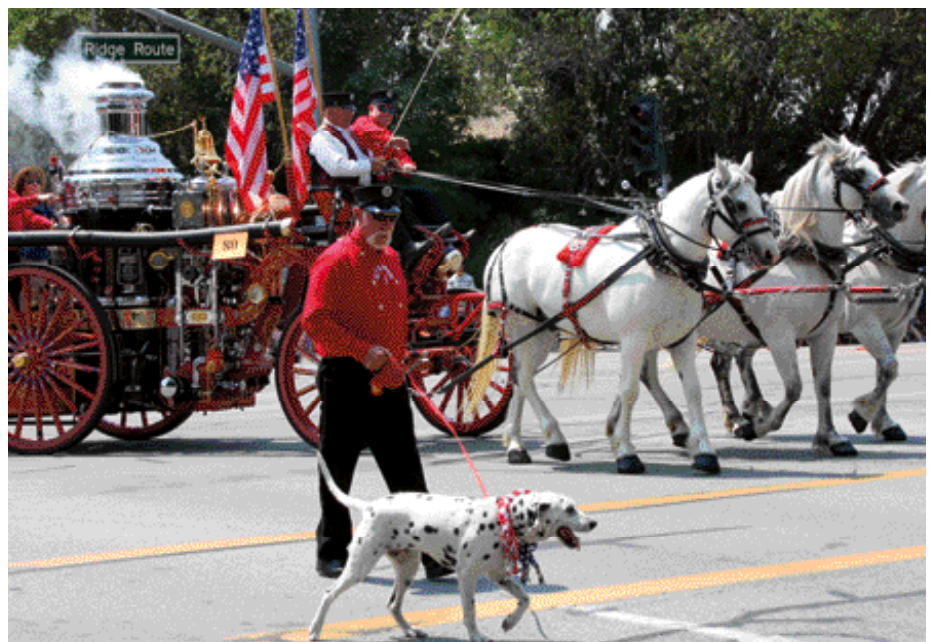
In het 19e-eeuwse Amerika is nog steeds sprake van begeleiding door Dalmatische Honden, maar nu van door paarden getrokken bluswerktuigen. Foto genomen in Lake Forest, Californië, tijdens de 4 Juli Parade. De Dalmatische Hond is in Amerika nu vooral gezelschapshond. (Fotograaf onbekend).

In Engeland fungeert de Dalmatische Hond in vroeger tijden als begeleider van koetsen; de Dalmatische Hond schijnt een natuurlijke affiniteit met paarden te hebben. In het negentiende eeuwse Amerika is nog steeds sprake van begeleiding, maar nu van door paarden getrokken bluswerktuigen. Vandaar dat dit ras in Amerika ook bekend staat als 'firehouse dog'. In 1888 wordt de eerste hond van dit ras door de American Kennel Club geregistreerd, maar dat ze er dan al tientallen jaren zijn, bewijst het schilderij met de 'Sacramento Indian'. ■