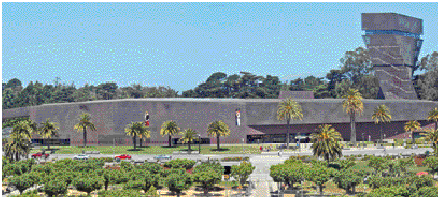
Het M.H. de Young Memorial Museum in San Francisco, waar 'Portrait of a Sacramento Indian with Dogs' nu hangt. Het museum bezit Amerikaanse kunst van de 17de tot de 21ste eeuw.