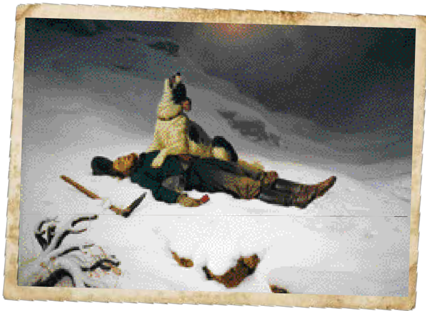
In hetzelfde jaar als waarin de 'Sacramento Indian' wordt geschilderd, maakt Charles Nahl ook 'The Dead Miner'. Het schilderij doet sterk denken aan dat van Sir Edwin Landseer, 'Alpine Mastiffs' uit 1820.

Morning in the Mines en The Dead Miner, herinneren aan de tijd dat hij zelf op zoek is naar goud en aan de streek waarin de Duitse familie zich settelt.