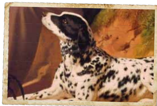
Detail van de liggende Dalmatische Hond.

een beetje een merkwaardig effect ten opzichte van het lichaam oplevert. Kijk ook even naar de fraaie halskettinkjes van de beide honden; daarin is de naam 'Latham' gegraveerd, een aanwijzing naar hun eigenaar. Dit alles vastgelegd in 1867, op een kleurrijk, intrigerend schilderij. Want