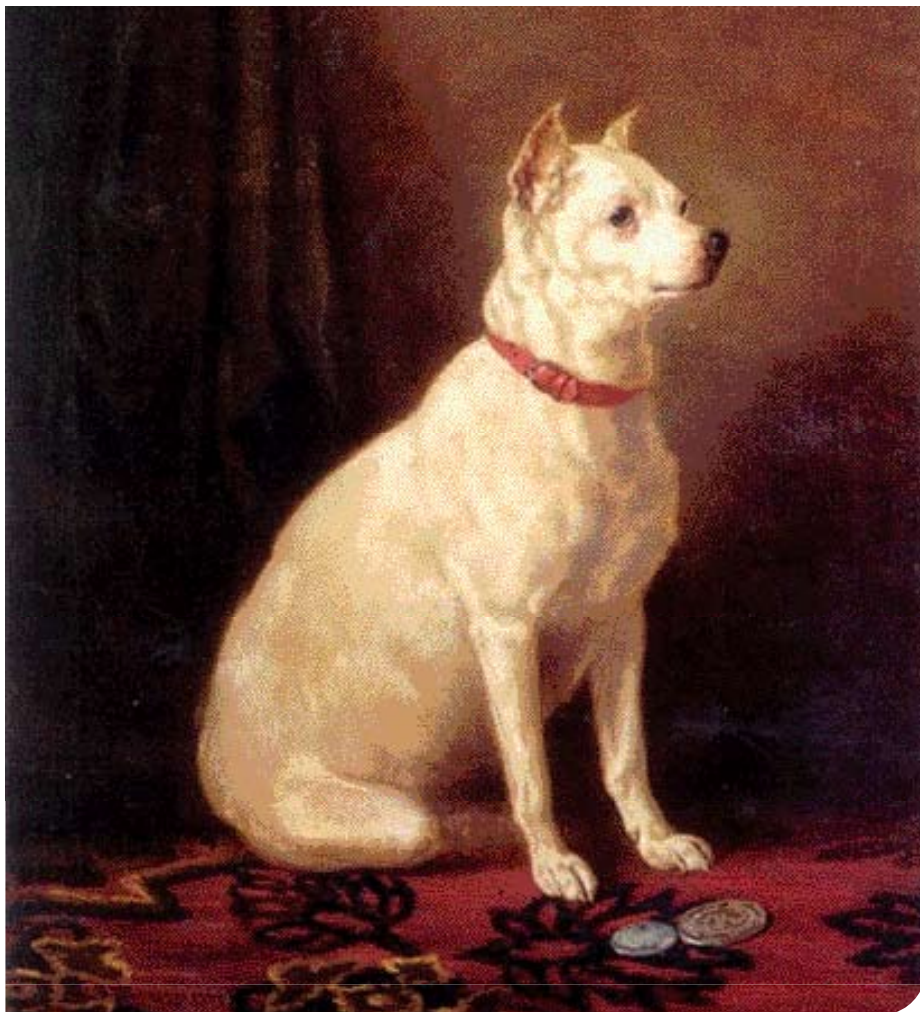
• White English Terrier, geschilderd door Alfred F. de Prades (+ 1879).