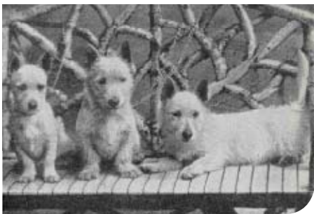
• Een oude foto van Roseneath of White Scottish Terriers, daterend van 1899.

we nu nog terug in de Ynysfor meute, die aanwijsbaar vanaf de tweede helft van de achttiende eeuw met Welsh Terriers jaagt.