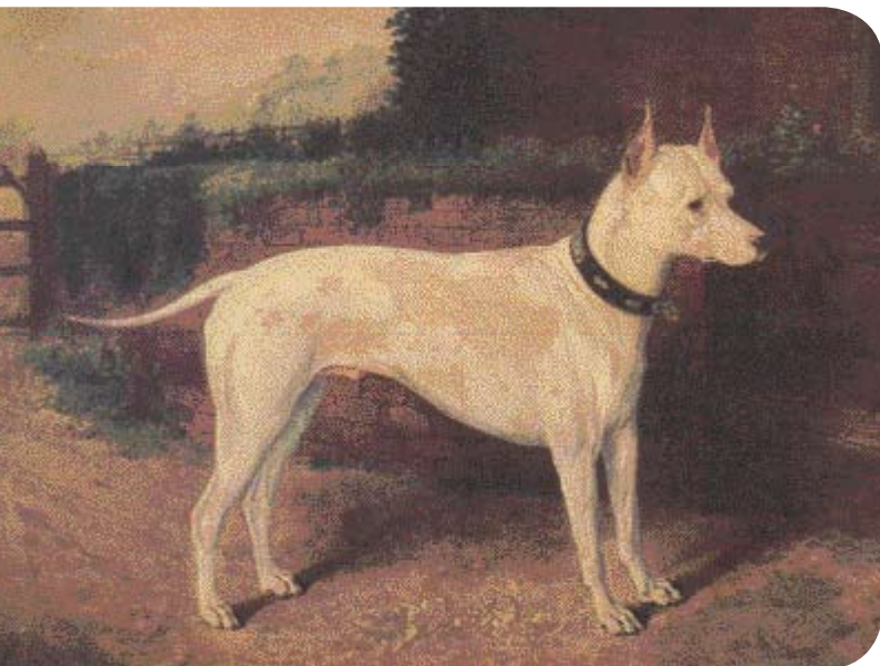
• Een prachtige afbeelding van E. Irsfeld van een Old English White Terrier, 1873.