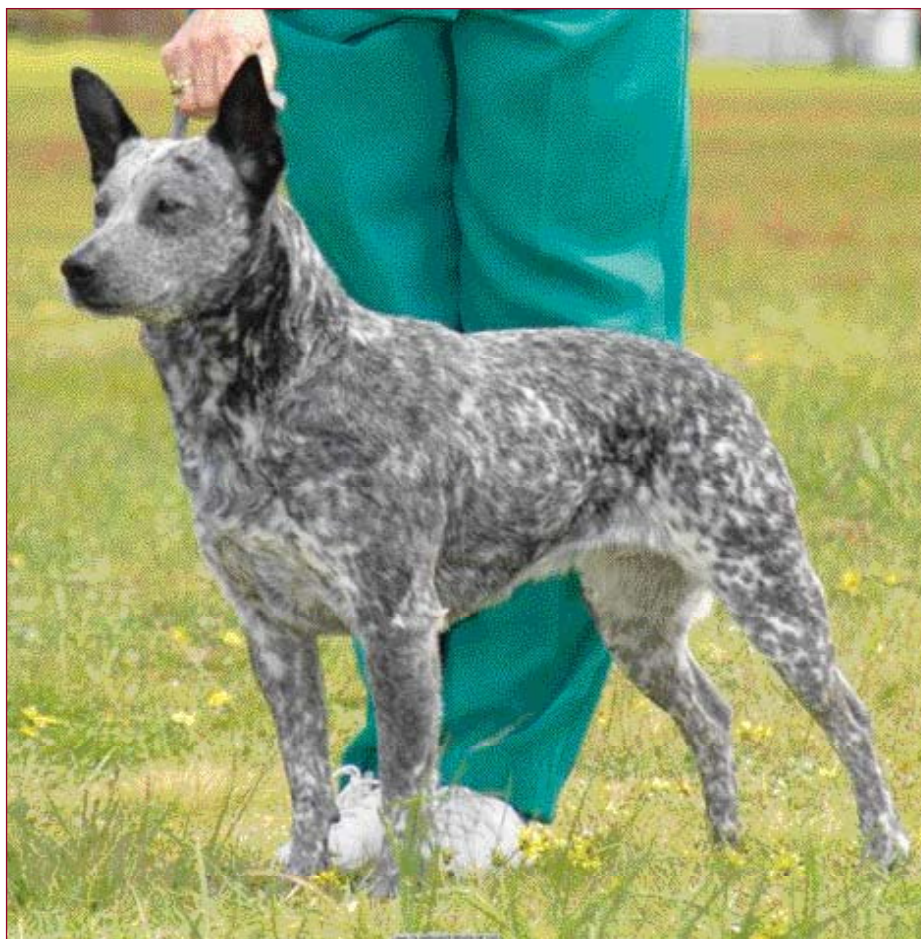
• De Australian Stumpy Tail Cattle Dog is zeker géén variëteit van de Australian Cattle Dog, maar een apart ras. Dit is Au. Ch. 'Ambajaye Head or Tail' uit Australië, gefokt door en eigendom van B. Merchant.