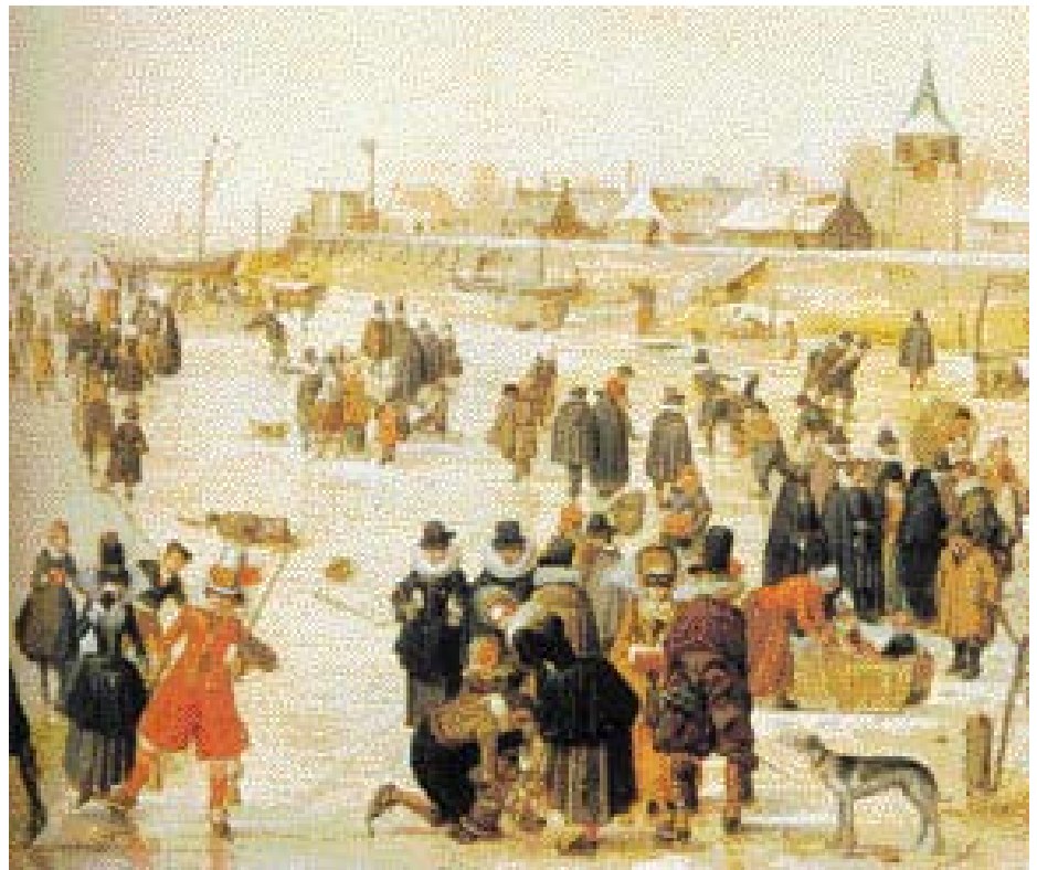
• Detail van een schilderij van Hendrick Avercamp uit circa 1620 getiteld 'Winterlandschap met ijsvermaak' met rechtsonder een windhond. Avercamp, die in zijn geboorteplaats Kampen 'naar het leven' schilderde, zal deze windhond dus echt op het ijs of in zijn omgeving hebben gezien.