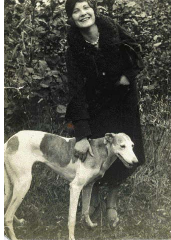
♦ Een goede, stamzuivere Friese Windhond teef. De blauwgrijs gestroomde platen zijn van een kleurslag dat destijds werd aangeduid met snoekkleurig. (Foto: Han Jüngeling uit collectie Ruud Haak).