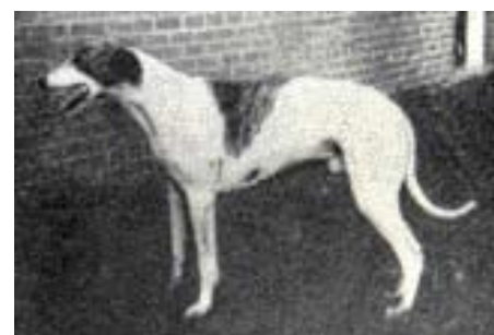
• Een 'Oud-Friesche Windhond' in Toepoels Hondencyclopedie van voor 1947.