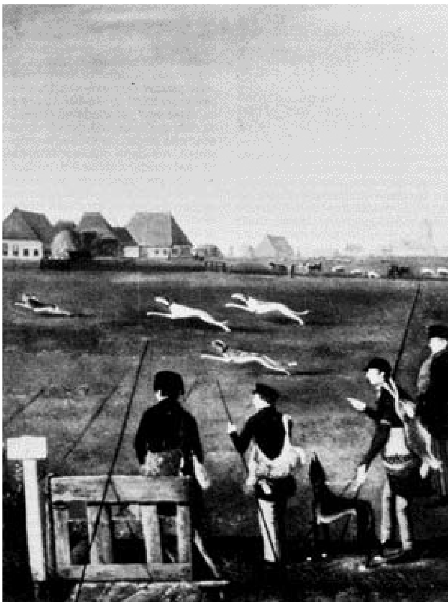
• Ongedateerde afbeelding van de lange jacht in Friesland. Een prachtig plaatje van een verdwenen traditie..

aantal keren aandacht aan de lange jacht, onder andere in januari 1906 en juli 1918. Beide artikelen komen ter sprake in een bijdrage over de lange jacht van Waidman (Gerrit Bakker), in het nummer van 19 december 1980. In Onze Hond van juni 1985 schrijft de kynoloog G. de Josselin de Jong het artikel 'Frysk Lange Houn – onze uitgestorven windhond' . En met 'onze' bedoelt hij zijn eigen Friese windhond, een cadeautje aan zijn moeder van baron Van Heeckeren. De Josselin de Jong schrijft: 'Niet oninteressant om te weten dat het voorvoegsel wind niets te maken heeft met windvlagen, doch stamt uit het Keltische 'ven', dat jacht betekent. Merkw aardigerwijs is dat woord wél blijven voortleven in het Franse: vénerie, veneur, zijnde: jachtbedrijf, jager.' Ook weet de schrijver te melden dat de kleurslag met de blauwgrijs ge-