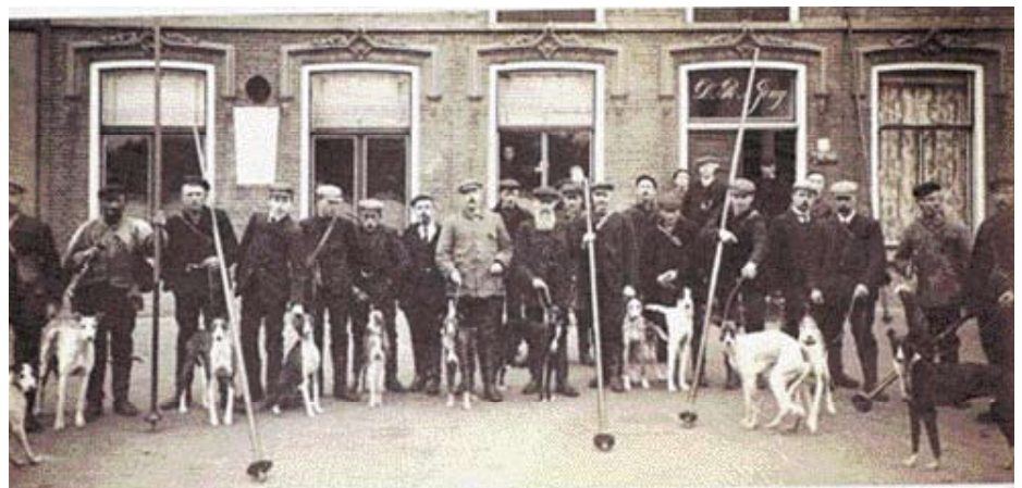
♦ Gezelschap gereed voor de lange jacht. Let op de polsstokken waarmee over brede sloten en vaarten wordt gesprongen.

zich vooral de schreeuw van het haas als de hond het dier grijpt en hier en daar is er ook dan al altijd wel iemand die de sport veroordeelt. Grappige voorvallen lezen we ook: zo gebeurt het meer dan één keer dat trekhonden van een toevallig in de buurt aanwezige hondenkar, de windhonden met kar en al achterna gaan, in de veronderstelling dat er verderop iets te beleven valt!