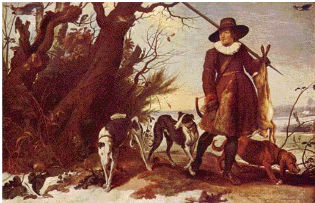
• 'Winterlandschap met jager' (1624) van Jan (van) Wildens. De twee windhonden worden vergezeld door een brak en de jager is met niets anders bewapend dan een lange stok. (Gemäldegalerie, Dresden).

De lange jacht is in de jaren rond de wisseling van de negentiende naar de twintigste eeuw een typisch Fries vermaak, te vergelijken met kaatsen en fierljeppen. Mensen die het hebben meegemaakt noemen de lange jacht een feestdag, waarop zo'n