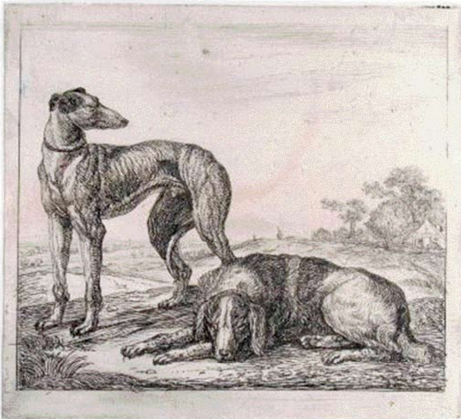
• Windhonden door de Nederlandse kunstenaar Simon de Vlieger (ca. 1600-1653).