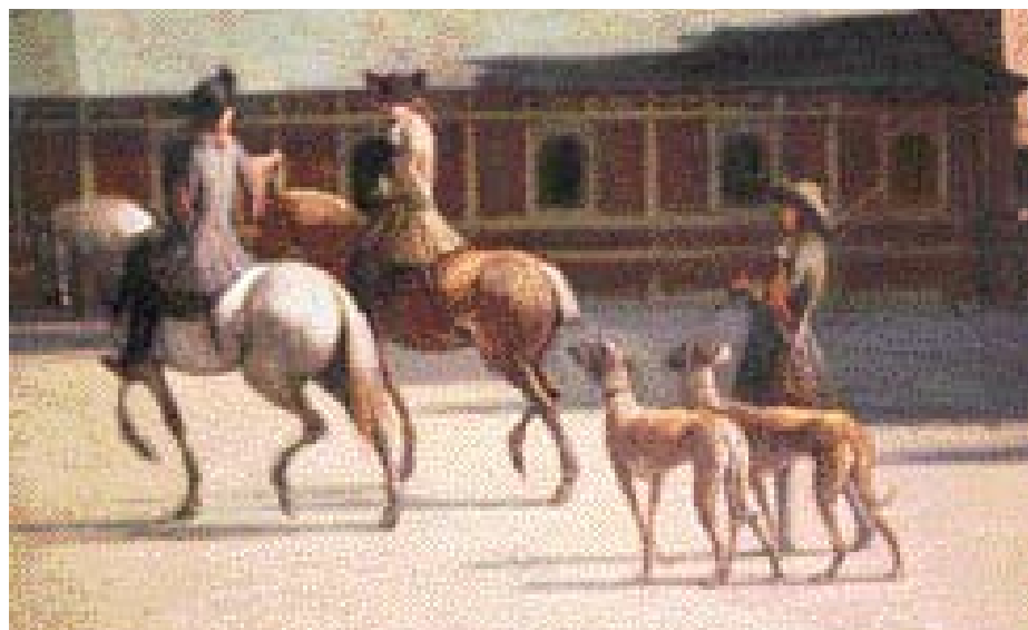
♦ Detail van een schilderij dat Gerrit Berckheyde in 1696 maakte van de Grote Markt in Haarlem met daarop twee windhonden.

Het is merkwaardig om te moeten constateren dat dit ras roemloos ten onder gaat, terwijl andere rassen nieuw leven wordt ingeblazen, ook op een moment dat hun aantal kritiek of zelfs geheel verdwenen is. Behalve de Friese en Drentse rassen zijn dat het Kooikerhondje, de Smoushond en het Markiesje. In de dertiende druk van Toepoels Hondencyclopedie is er geen lemma voor Friese Windhond meer, maar wel voor de lange jacht. Er staat veelbetekend: Zie Brakken.