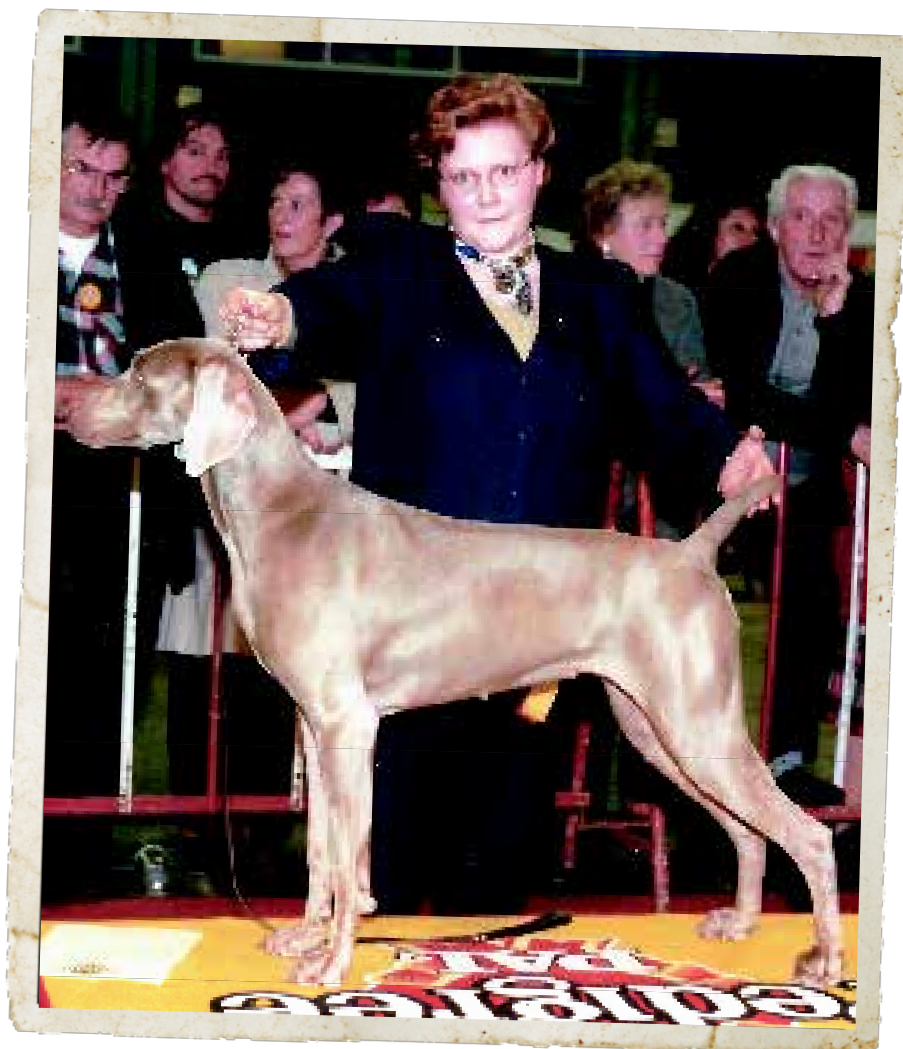
Chantal op de Brabo Tentoonstelling in 1997.

Korthaar 'Offspring Proud of the Grey Noble' en langhaar 'Aéghyr Flash of the Windy Spot'