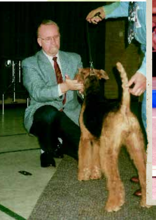
Airedale Terrier keuring door Theo van de Horst in 2000.