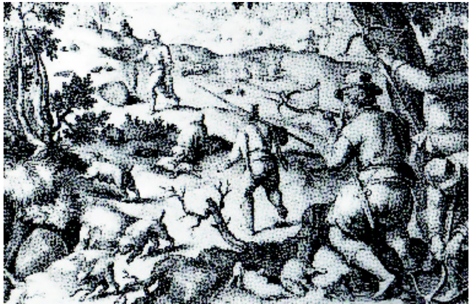
Een bekende prent van Johannes Stradanus van circa 1600 verbeeldt de konijnenjacht en daarop zijn, met een beetje fantasie, Teckelachtige hondjes te zien.