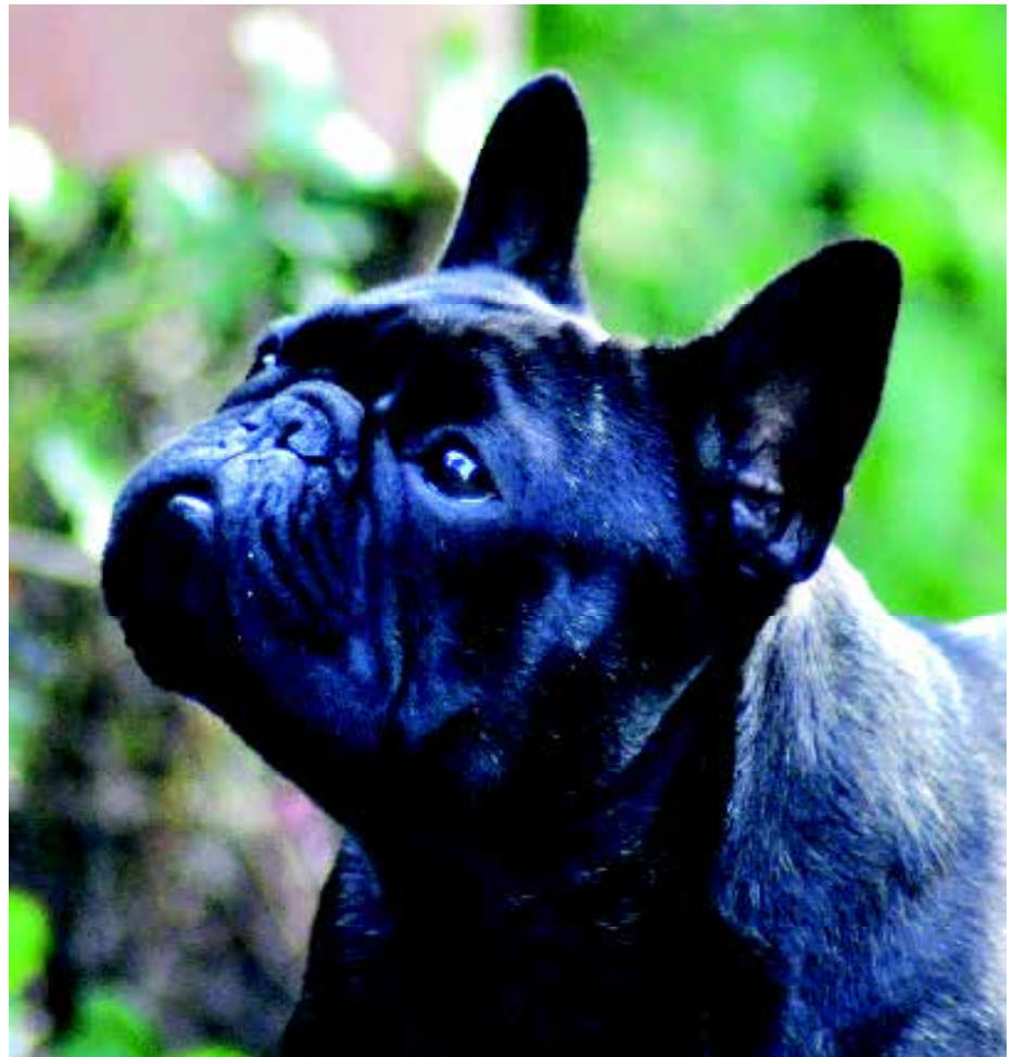
Multi Ch. Kokette de la Parure wordt Best of Breed op Crufts 2015.