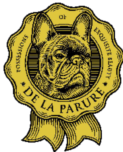
Logo 'de la Parure', wereldwijd bekend.