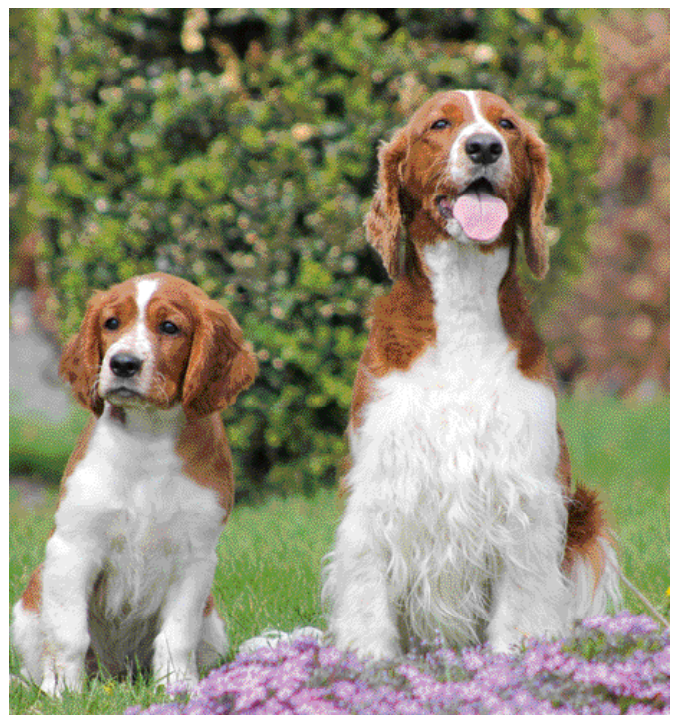
De fokker is er verantwoordelijk voor dat het ISAG 2006 DNA-profiel van een buitenlandse reu tijdig bij de Raad van Beheer aanwezig is.