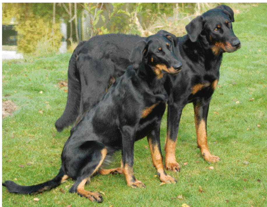
De verplichte DNA-afname en -afstammingscontrole raken de kern van de rashondenfokkerij, nu in positieve zin.

Het DNA-materiaal wordt in de verzegelde envelop naar het Van Haeringen Laboratorium (VHL) in Wageningen gezonden. Daar wordt het monster opgedeeld en vindt opslag plaats. Vervolgens gaat een gedeelte van het monster verzegeld naar het laboratorium van Certagen