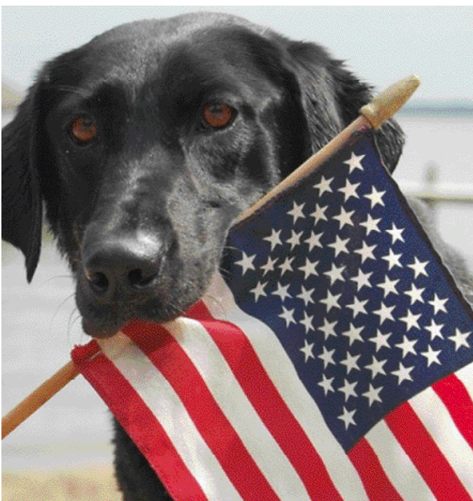
De fokker is er verantwoordelijk voor dat het ISAG 2006 DNA-profiel van een buitenlandse reu tijdig bij de Raad van Beheer aanwezig is. (Foto: Marinus Nijhoff).

De vraag of een importhond, voorafgaand aan de inschrijving in het Nederlandse Honden Stamboek (NHSB), moet beschikken over