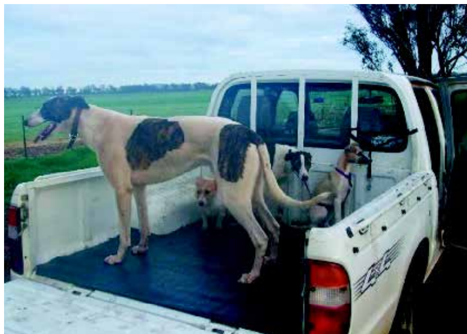
Een Roo Dog in de laadbak van een truck. De andere honden zijn ook 'windhonden types'.

De naam van deze hond is afgeleid van de Strathdoon kennels in Blacktown, New South Wales. Dit type is speciaal ontwikkeld voor de jacht op dingo's. Aan het einde van de 19de eeuw importeert een zekere Cecil Davies twee Deerhounds, in Engeland bekend van de tentoonstellingen: Lord Morag en Newton Spey . Daarmee start hij zijn 'Strathdoon' kennel en fokt in de loop der jaren meer dan 100 Deerhounds. Davies fokt ook Borzoi's en maakt promotie voor Deerhound x Barzoi puppies, die al snel 'Strathdoon Dingo Killers' worden genoemd en op dingo's en kangoeroes jagen. In de laatste jaren van de 19de en het in begin van de 20ste eeuw verspreidt dit 'ras' zich ook over