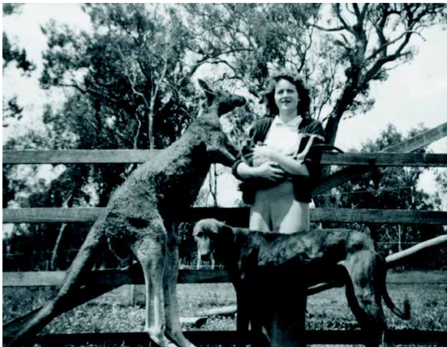
Een ongebruikelijke foto: een kangoeroe en een Kangaroo Hound, gewoonlijk twee vijanden.

Temperament: nasty disposition. Bij de jacht is een gevecht op leven en dood geen zeldzaamheid. Het bijzondere is dat er bij deze kangoeroejacht geen wapens worden gebruikt. Het is jagen en doden zonder dat er mensenhanden aan te pas komen. Hoewel er geen sprake is van zuiver gefokte lijnen, is er bij de Kangaroo Dog wel sprake van aparte bloedlijnen. In een land dat zo uitgestrekt is als Australië ontstaan bijna vanzelf aparte lijnen: de Deernbull, Western Australian Wheatbelt lijn, de Western Australian lijn en de South Australian Staghound. De site www.kangaroodog.org scheidt een beetje duidelijkheid in de chaos en heeft wat oude foto's van de Kangaroo Hound. In 1839 arriveert een Kangaroo Hound in de Zoological Garden in Londen en in 1864 worden er twee tentoongesteld door de Prince of Wales, als a curiosity , op de Second International Dog Show in Londen.