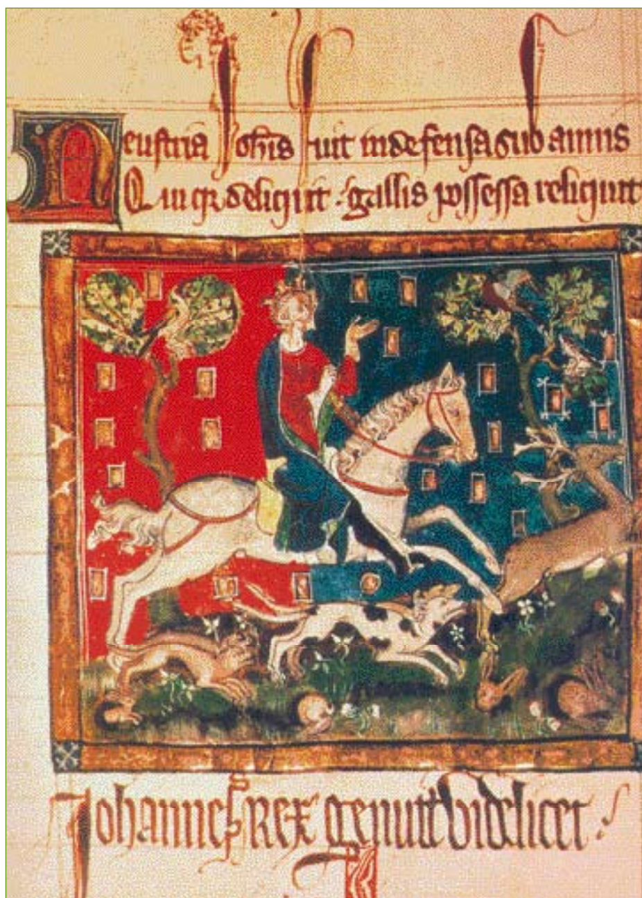
• Middeleeuwse afbeelding van de Engelse koning John (circa 1166-1216), zittend op een wit paard tijdens de hertenjacht. (Uit: Liber Legum Antiquorum Regum, circa 1321).

P as vanaf de vroege middeleeuwen ontwikkelt de jacht zich ook tot een meer sociale en recreatieve bezigheid, met eigen regels, gewoonten en tradities.