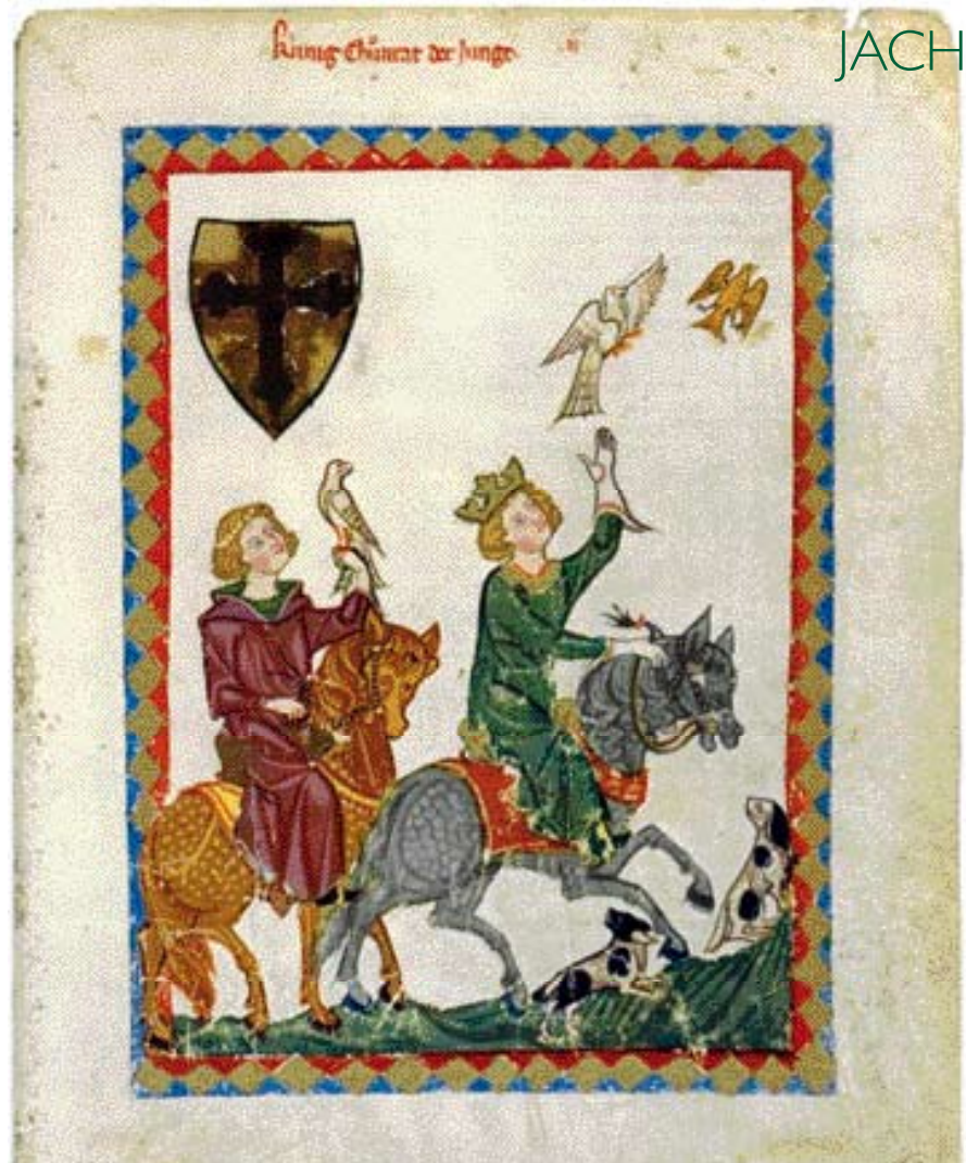
• De koning rijdt ter vogeljacht. Koning Konrad de Jonge (1252-1268), afgebeeld op een miniatuur in het veertiende eeuwse Grosser Heidelberger Liederhandschrift .

De Engelse koning John, uit het huis Plantagenet, wordt geboren rond 1166 en regeert van 1199 tot 1216. De middeleeuwse afbeelding van deze koning, zittend op een wit paard, is afkomstig uit het Liber Legum Antiquorum Regum , verschenen rond 1321 en dat, vrij vertaald, het Boek van de Wetten van de oude Koningen heet. In deze periode hoeft degene die wordt geportretteerd absoluut niet te lijken. Wel is het belangrijk dat men uit de verschillende attributen op de afbeelding kan