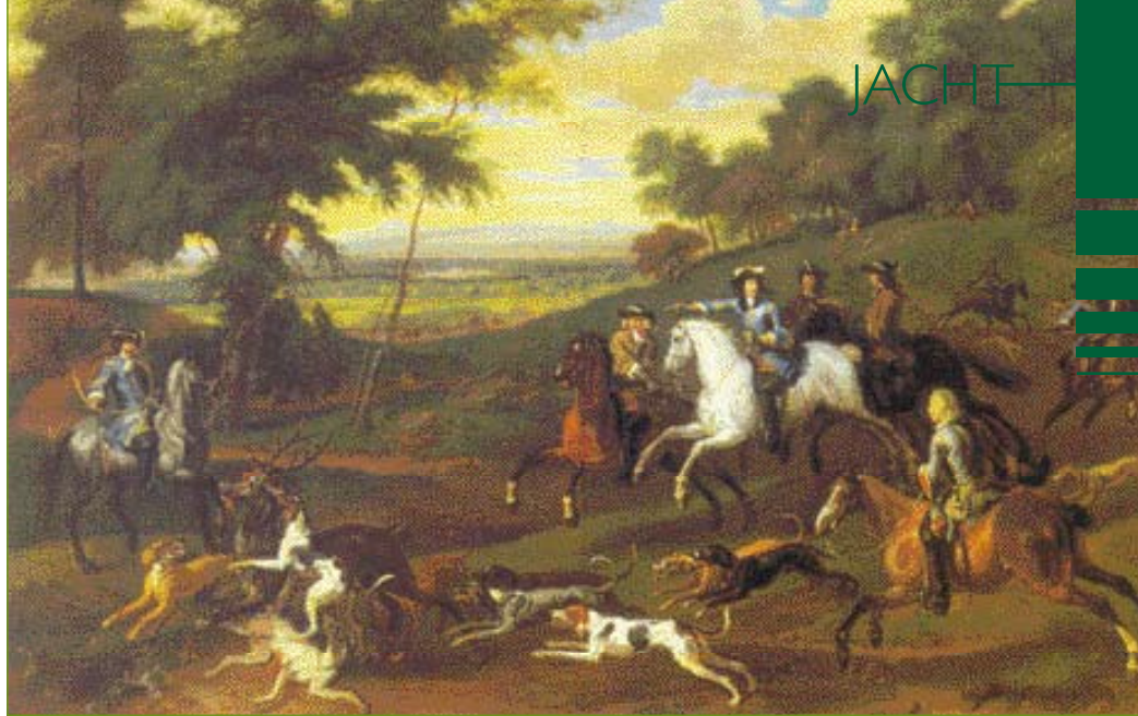
• Koning-stadhouder Willem III (1650-1702) tijdens de parforce jacht. Een schilderij van Dirk Maas uit 1700.