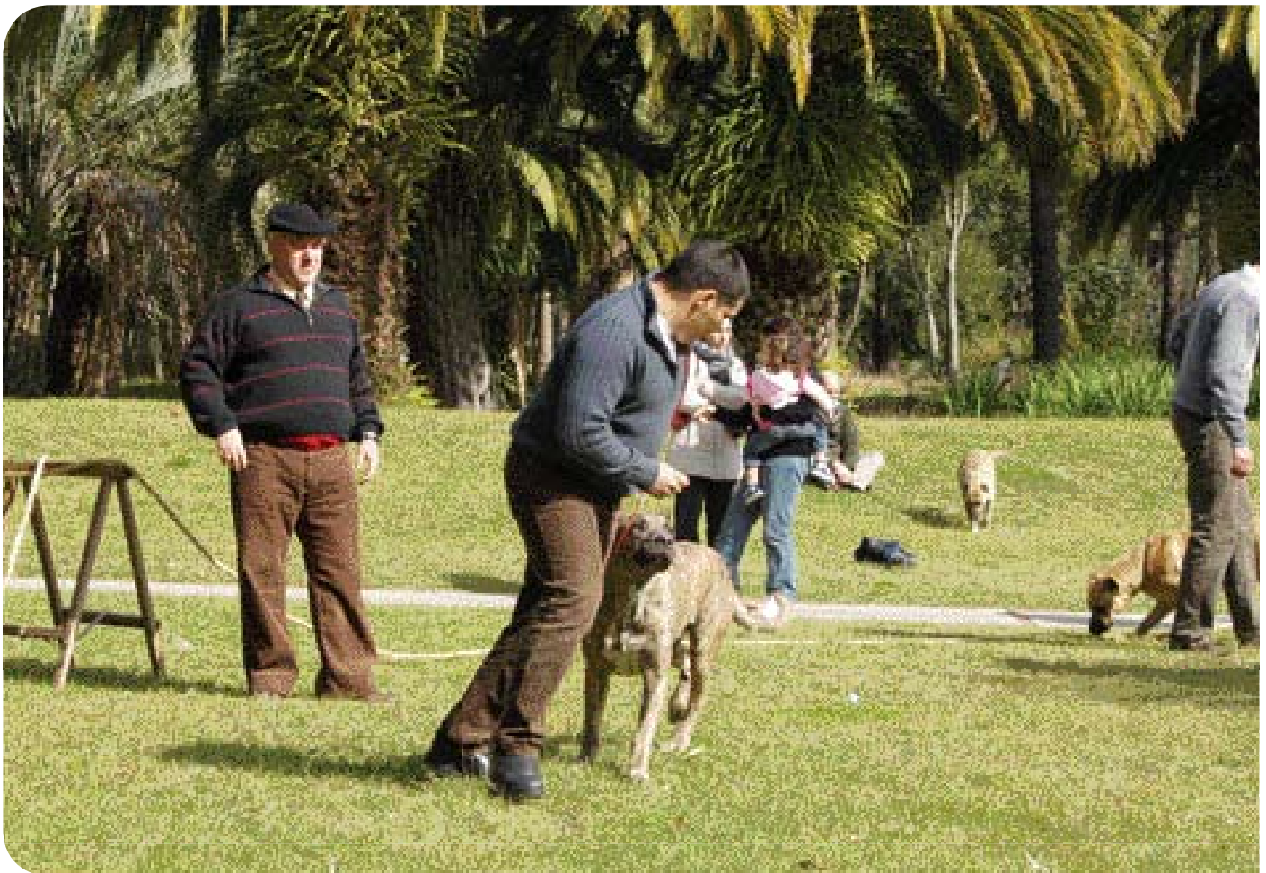
• Het voorbrengen van Cimarróns in Uruguay, in de openlucht.

Juan Diaz de Solis om tijdens diens ontdekkingsstocht op de Rio de la Plata. Die moord veroorzaakt dat Spaanse kolonisten dit gedeelte van het land voorlopig niet meer in hun tochten opnemen. Zilver en goud lokken Europeanen naar dit deel van Zuid-Amerika en met hen komen, in de zeventiende eeuw, de honden, paarden en koeien naar Uruguay. In 1726 nemen de Spanjaarden de stad Montevideo in, tot dan in het bezit van de Portugezen. Bij deze acties vinden honderden autochtone bewoners de dood. Vijftig jaar later gaat Uruguay deel uit maken van de Virreinato del Rio de la Plata , waarvan Buenos Aires (nu in Argentinië) de hoofdstad is. Als Napoleon in Europa de Spaanse monarchie onttroont, breekt er ook in Uruguay een opstand