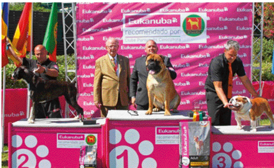
Groepskeuring op de Internationale Show in Lissabon, Portugal – de Clube Português de Canicultura.