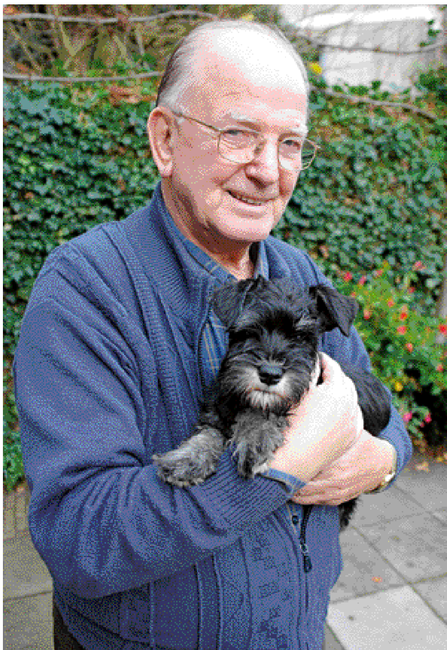
Evert en Dwerf Schnauzer Vulco van Ahrensfeld. Een zeer vrolijk en vriendelijk hondje, dat stemmingen perfect aanvoelt.