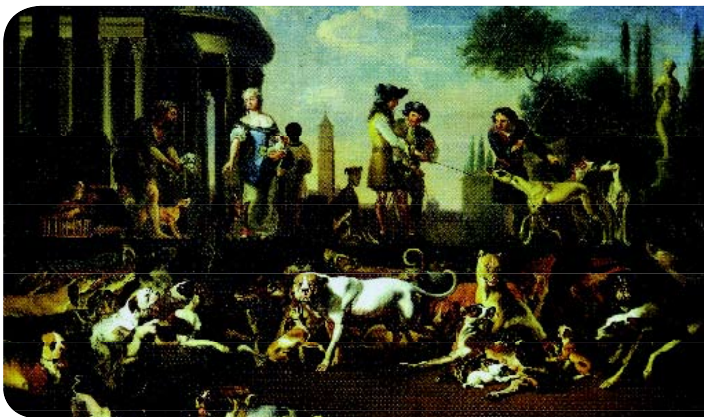
• 'De Hondenmarkt' of 'De honden van de Palatine' van Abraham Hondius (1625-1691).

De aanschaf van een rashond en de verkoop van honden op markten zijn twee werelden die elkaar per definitie lijken uit te sluiten. Hondenmarkten en straatverkoop van honden zijn er echter altijd geweest en zullen er waarschijnlijk ook altijd blijven...