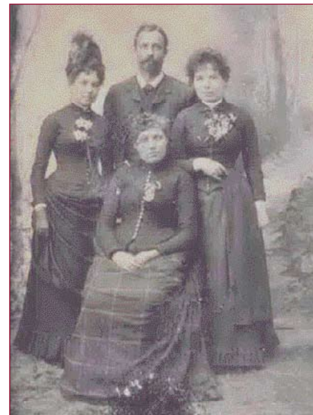
Oshkosh Public Museum

in 1905 dat er lichte, zwarte, bruin en wit getijgerde, zilvergrijze en driekleurige types zijn, die op de oude 'Leithund' lijken, en die zowel kortharig als ruwharig zijn. Waarschijnlijk behoort de Duitse Staande Korthaar tot het oudste continentale voorstaande ras. Rond 1870 ontstaat bij jagers de drang om te jagen met typen die ook door hun vaders en grootvaders zijn gebruikt. Opkomend nationalisme na de Frans-Duitse oorlog van 1870-71 speelt een rol in de ontwikkeling van een échte Duitse jachthond. In mei 1878 verschijnt een aantal Duitse voorstaande honden op een tentoonstelling; ze verschillen echter behoorlijk veel van elkaar. In 1879 worden in Hannover raspunten opgesteld, waarbij de reu 'Hektor 1', eigendom van jachttopziener Hesse, model staat. Richard Strebel maakt een tekening van deze Hektor: een lange hond met een doorgezakte rug en een zwaar, Bloedhondachtig hoofd. Om een betere neus te krijgen, wordt de Engelse Pointer gebruikt en vanaf 1884 neemt de fokkerij van dit ras een grote vlucht. Uit die zware, langzame honden is een lenige gebruikshond gefokt, die met een hoge neus zoekt, voorstaat en