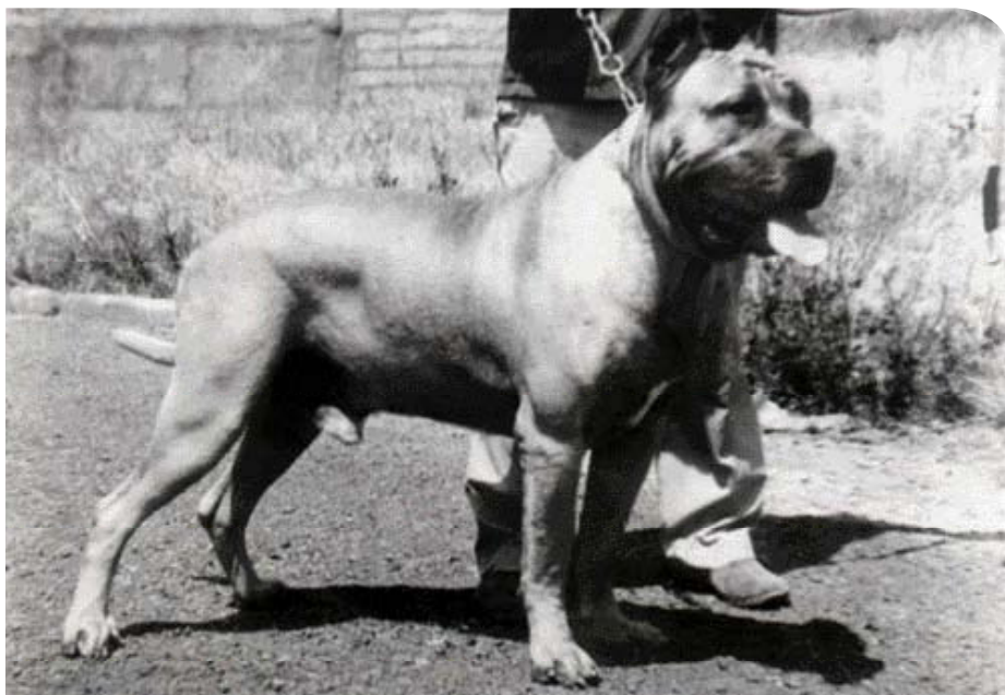
• Foto van een Dogo Canario type van voor 1980.

de populariteit en in de jaren zestig van de vorige eeuw is de Perro de Presa op sterven na dood.