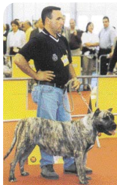
♦ De eerste keer dat een Dogo Canario op een Wereld Show verschijnt is in Portugal in 2002.

Alle pogingen zijn in het werk gesteld om de namen van de fotografen van de foto's te achterhalen. Dit is niet altijd gelukt. Wie rechten op afbeeldingen meent te hebben, kan contact opnemen met de auteur.