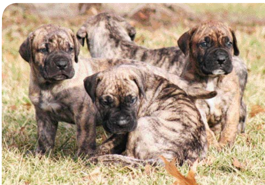
• Vier weken oude pups uit de Cabeza Grande kennel in de U.S.A.

Perro de Presa is dan een verzamelnaam voor alle honden die jagen, ook die op het Spaanse vasteland. Waarschijnlijk dankzij de Engelsen krijgen de Perros de Presa – presa betekent buit, prooi of vangst – een nieuwe 'taak': de hondengevechten, die veelal in het geniep worden gehouden. Als dat rond 1940 wordt verboden, is het meteen gedaan met