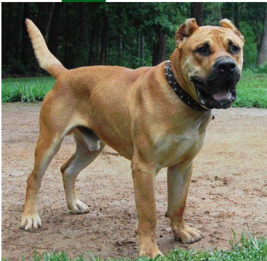
• Dogo Canario reu uit de Sanders kennel in de U.S.A.