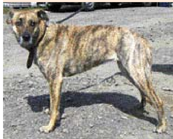
• De Bardino Majorero, afkomstig van het eiland Fuerteventura, levert een bijdrage aan de reconstructie van de moderne Dogo Canario. (Foto: Heinz Steffen, Wikipedia).