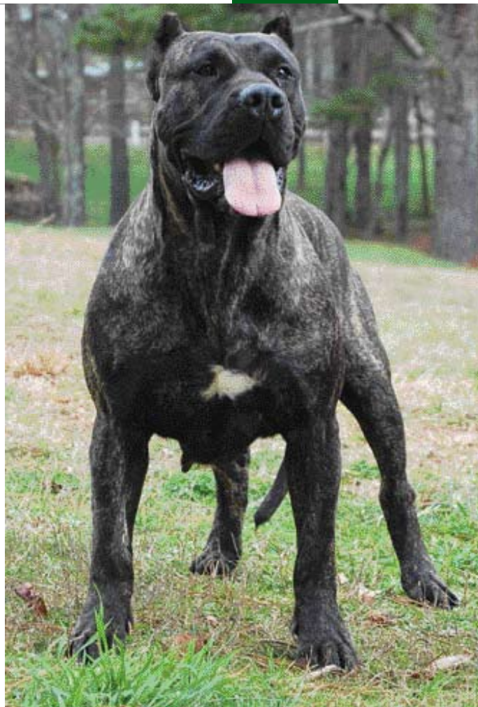
• Een Dogo Canario teef uit de Warnsey kennels. Let op het front dat sterk doet denken aan dat van een Engelse Bulldog.

een specifiek molosser uiterlijk, maar toch lenig en krachtig, met een sterk temperament, robuust en levendig en met een loyaal karakter. Gedurende de zestiende en zeventiende eeuw, nam hun aantal aanmerkelijk toe en vele verwijzingen naar deze honden zijn te vinden in historische teksten die dateren uit de tijd voor de veroveraars. Deze teksten zijn vooral te vinden in de 'Cedularios del Cabildo' (gemeentelijke registers), die een verklaring geven voor hun oorspronkelijke werk als waakhonden en beschermers van vee.