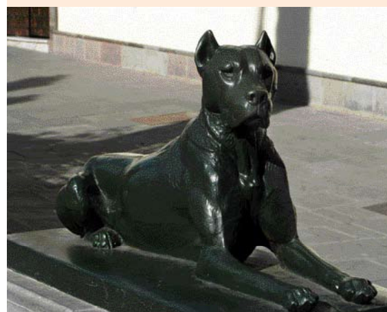
• Beeld van een Dogo Canario in Las Palmas (Gran Canaria), op het Santa Anaplein voor de kathedraal.