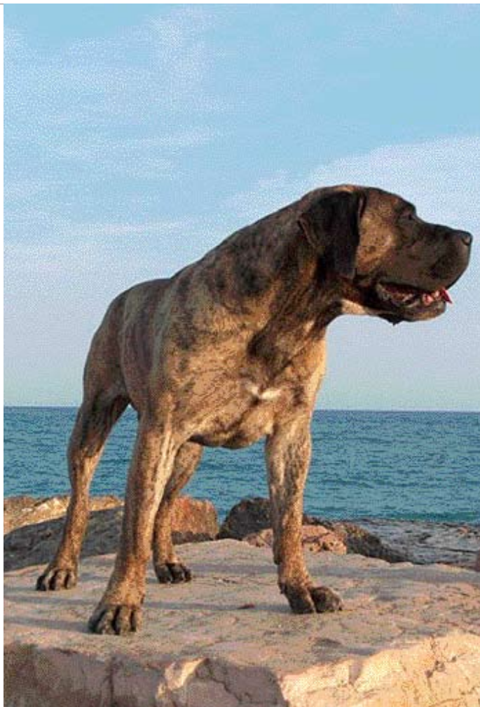
• Een Dogo Canario met ongecoupeerde oren.