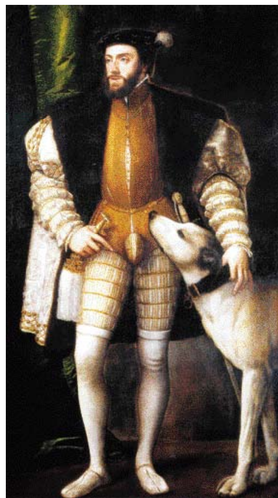
• Keizer Karel V (1500-1558) van 1516 tot 1556 als Karel I koning van Spanje. Een schilderij van de Italiaanse schilder Titiaan (circa 1487-1576) die de keizer afbeeldt met een wit-grijze hond van het doggentype. (Museo del Prado, Madrid).

De Canarische Eilanden zijn ontstaan uit vulkanische uitbarstingen; ze vormen een archipel van eilanden, met bergen van 3.700 meter en een zee ertussen die hier en daar 3.000 meter diep is. De eilandengroep, met 1,5 miljoen inwoners, hoort bij Spanje en ligt voor de West-Afrikaanse kust in de Atlantische Oceaan. De huidige bevolking bestaat uit een vermenigving van Guanchen (de oorspronkelijke bewoners), Portugezen en Spanjaarden. Namen als Tenerife, La Palma, Fuerteventura, Gran