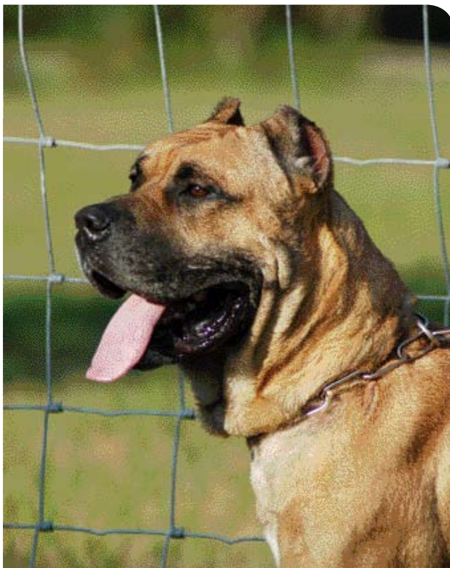
♦ Dogo Canario uit de KMB Presa kennels.

Tot de fouten worden onder andere gerekend: hangende oogleden, een masker dat reikt tot boven de ogen, naar binnen of naar buiten draaiende voeten en verkeerde verhoudingen van de voorsnuit ten opzichte van de schedel. Het ras heeft in Nederland nog geen rasvereniging. <