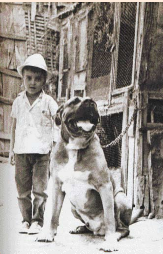
• Foto uit de jaren vijftig van de vorige eeuw van een voorloper van de Dogo Canario.

in het bezit zijn van pekmakers en muilezeldrijvers en andere arme mensen, die de honden meenemen op hun tochten, waar ze jagen en stelen wordt iedereen die een hond heeft bevolen deze te doden. Maar: deze maatregelen gelden niet voor slagers, die vlees snijden en wegen. Elk van hen mag op de vleesmarkt twee honden hebben, die dag en nacht vastgebonden moeten zijn. Ze mogen alleen worden losgelaten om vee op te drijven. Ook de honden die in de buitenwijken van de stad worden gehouden om zwerfhonden te doden, mogen blijven, omdat men vindt dat zij een nuttige taak verrichten. Nergens in de archieven wordt gesproken over het uiterlijk van deze honden. Belangrijker is wie overlast bezorgt en wie nuttig werk doet.