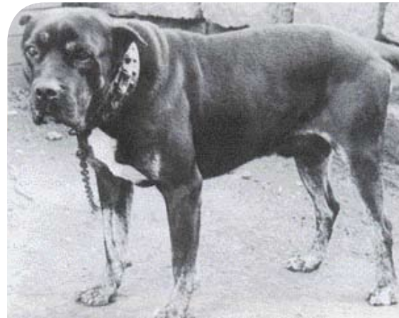
• Een type Dogo Canario uit 1952, waarbij de invloed van de Majorero nog goed is te zien.

In de jaren van de veroveringen en kolonisatie van de Canarische Eilanden, de vijftiende, zestiende en zeventiende eeuw, worden honden steeds belangrijker. Ze kunnen het vee drijven en bewaken en op de wilde honden jagen. Pas heel veel later gaat men hen gebruiken als bewakers van have en goed. Over het algemeen spreekt men in die eeuwen over 'prooihonden', maar gegevens over hun uiterlijk zijn er op de eilanden nog steeds niet. Op het vasteland van Europa – en met name in Spanje – is dat zeker wel het geval. In zijn boek Los Toros Encyclopedia schrijft Jose María de Cossío over dit type en noemt hen 'Alanos'. Ze zijn: sterk en dik, met een groot hoofd, hangende oren die meestal gecoupeerd zijn, een platte neus en een lange staart . Spaanse en Italiaanse schilders uit deze periode – zoals Velasquez, de Goya en Titiaan – hebben er diverse vereeuwigd – honden van het doggen- of mastifftype.