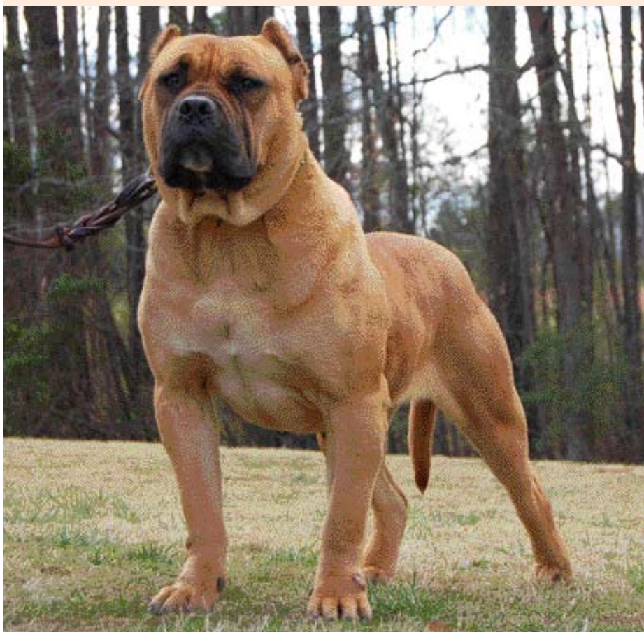
• Dogo Canario teef uit de Amerikaanse Sanders kennel.

dateren van na 1975. Hij noemt ook de rassen die zijn gebruikt: Engelse Mastiff, Mastino Napoletano, Engelse Bulldog, Bull Terrier, Staffordshire Bull Terrier, Bullmastiff, Duitse Dog en de Rhodesian Ridgeback. Voorts de Perro de Ganado Majorero, Spaanse Mastiff, American Pit Bull Terrier, Dogue de Bordeaux, American Staffordshire Terrier (na 1980) en anderen. De Ganado Marjorero of Bardino Majorero verdient enige toelichting; dit is een oud type herdershond dat afkomstig is van het eiland Fuerteventura.