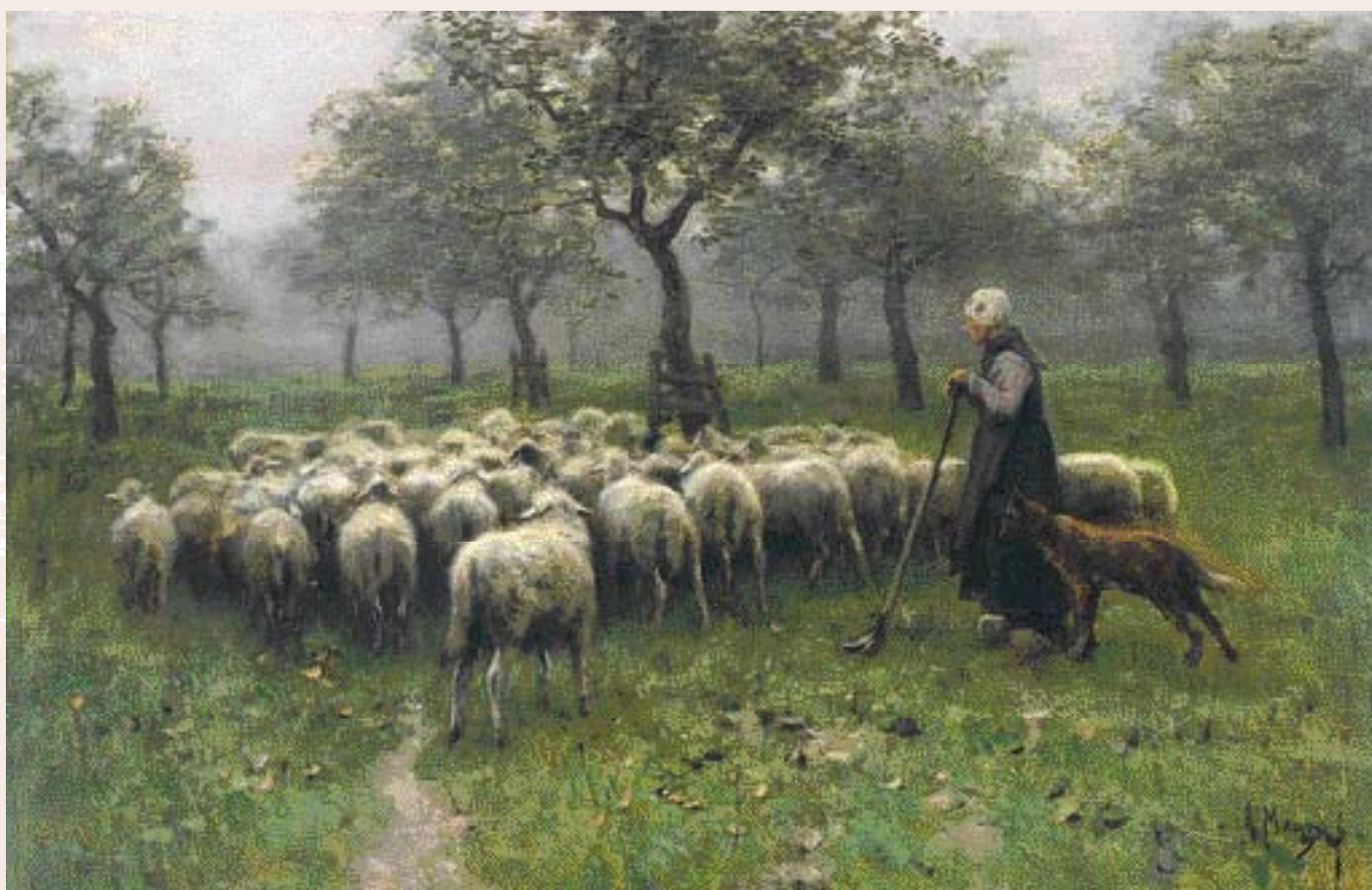
• 'Herderin met kudde schapen in een boomgaard' van Anton Mauve (1838-1888).

Ze spelen, rennen achter wild aan, verzorgen pups of kijken ons alleen maar aan: honden op schilderijen. Schilderstukken die onmisbaar zijn bij het ontrafelen van de geschiedenis van rashonden...