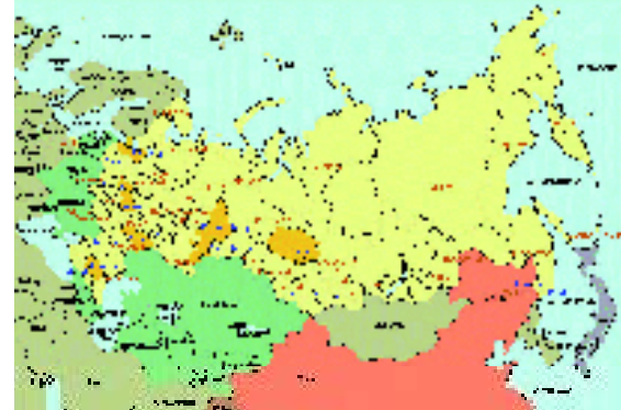
♦ Kaart van het moderne Rusland.

♦ In 1805 publiceert Sydenham Edwards in zijn 'Cynographia Britannica' deze afbeelding van de dan in Engeland voorkomende terriers. Links bovenaan een voorloper van de Manchester Terrier en Engelse Toy Terrier en daarmee ook van de van Russkiy Toy Terrier. (Let even op de terrier rechts boven met de blikkerende tanden!)