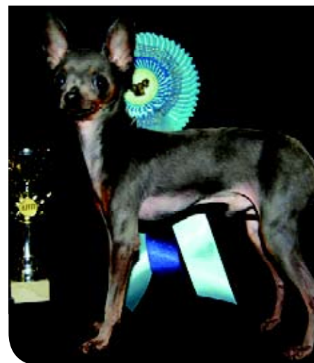
♦ Een blue-and-tan Russkiy Toy komt relatief heel weinig voor.

gen. Het beenwerk is dun en fijn; de schouderbladen zijn middelmatig lang en lopen niet te veel af. De opperarm vormt een hoek van 150 graden met het schouderblad. De lange voorbenen zijn recht met een soepele pols. De kleine voorvoeten zijn ovaal van vorm en mogen niet naar binnen, noch naar buiten draaien. De licht gewelfde tenen staan dicht op elkaar. Bij de achterhand zijn de dijbenen soepel en goed ontwikkeld; de achterhand is voldoende gehoekt. De gewelfde achtervoeten zijn een beetje smaller dan de voorvoeten. Een Russkiy Toy loopt snel, soepel en gemakkelijk en tijdens het gaan moet de ruglijn strak blijven. De dunne, droge huid staat strak om het lichaam gespannen. De structuur van de beide haarvariëteiten wordt uitvoerig vermeld in de rasstandaard, evenals de toegestane kleuren. Die kleuren zijn: black-and-tan, bruin en tan, en blauw en tan. Laatstgenoemde is de meest zeldzame kleur. Voorts rood in allerlei tinten