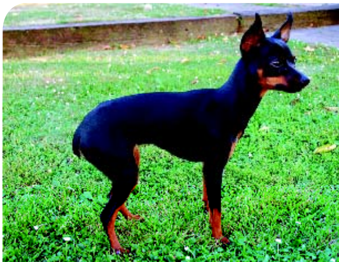
♦ Een Prazský Krysářík (Praagse Rat Terrier) is een (niet erkend) rashondje dat ook snel kan worden aangezien voor een Russkiy Toy..