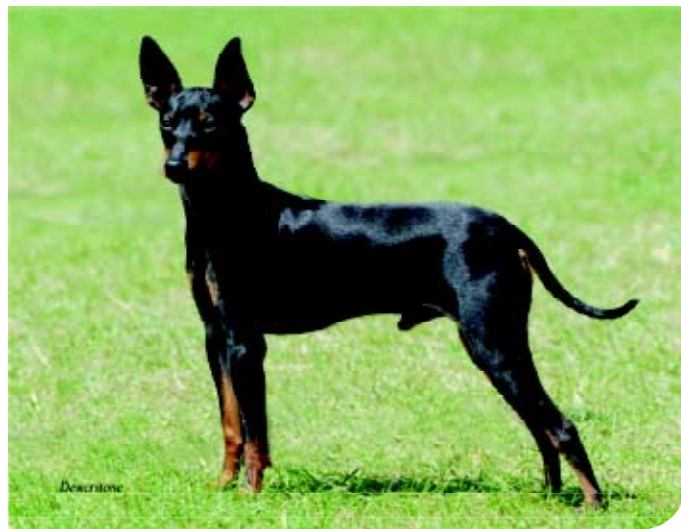
♦ Een moderne Engelse Toy Terrier uit de Britse kennel 'Amalek'. Dit ras is uitsluitend black-and-tan.

zijn de Engelse rassen – niet alleen honden maar ook paarden – favoriet. Russische aristocratische dames vertonen zich op party's en in de theaters met kleine Engelse Toy Terriers op hun arm of in de mouw van hun jas. Op een hondenshow in St. Petersburg, in 1907, zijn al elf Toy Terriers aanwezig.