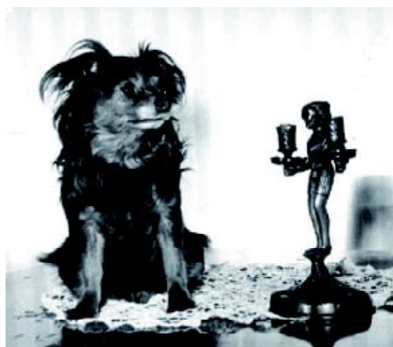
• Dit is de reu 'Chiki', geboren op 12 oktober 1958 die bij het opgroeien 'spectaculaire vlaggen' aan de oren, de hals en aan de benen krijgt. Hij is black-and-tan en is de stamvader van alle langharige Russkiy Toys.