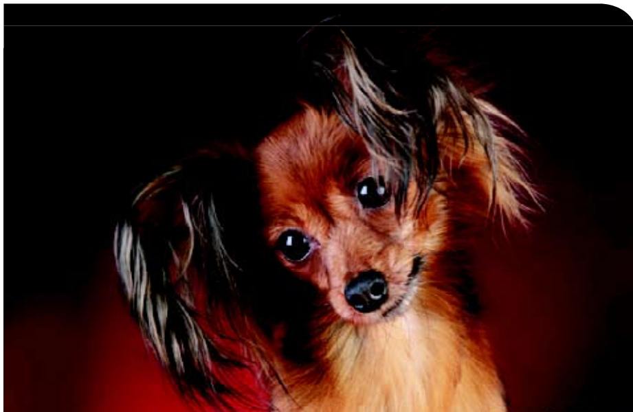
• De komst van de langharige Russkiy Toy in 1958 berust min of meer op toeval.

variëteit Moskouse langharige Toy Terrier of Moskouse Miniatuur langharige Terrier. De toevoeging Moskouse ontstaat, omdat een fokster in die stad een hoofdrol speelt bij de ontwikkeling van de langharige variëteit.