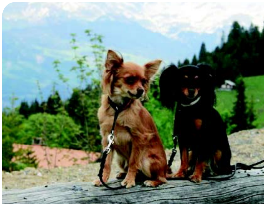
♦ Russkiy Toys langhaar uit de Zweedse kennel 'Stolt' in twee kleuren: rood en black-and-tan.

Alle pogingen zijn in het werk gesteld om namen van fotografen van foto's te achterhalen. Dit is niet altijd gelukt. Wie rechten op afbeeldingen meent te hebben kan contact opnemen met de auteur: horter@tiscali.nl