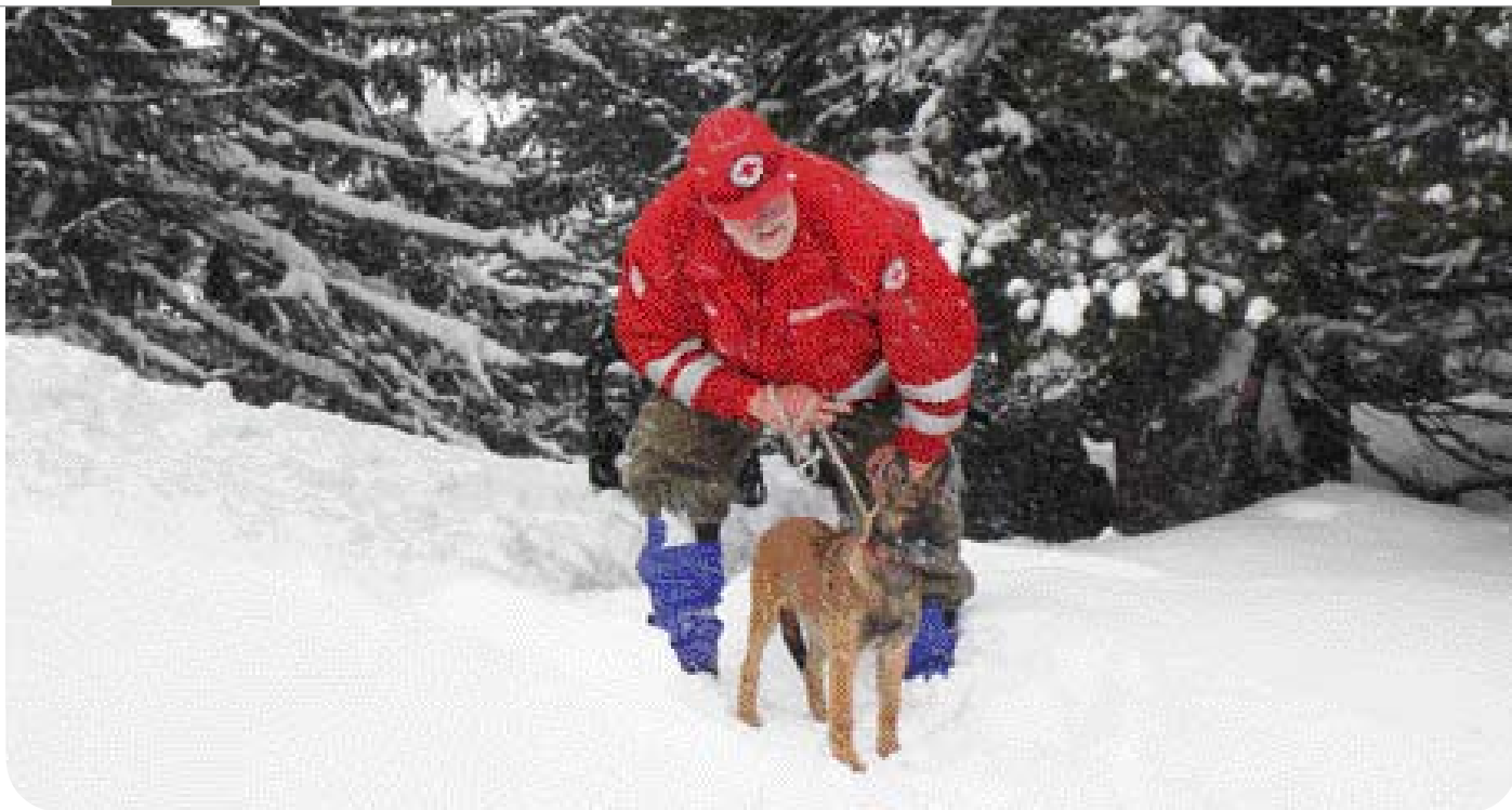
• Een jonge Mechelaar in opleiding tot reddings- en lawinehond.