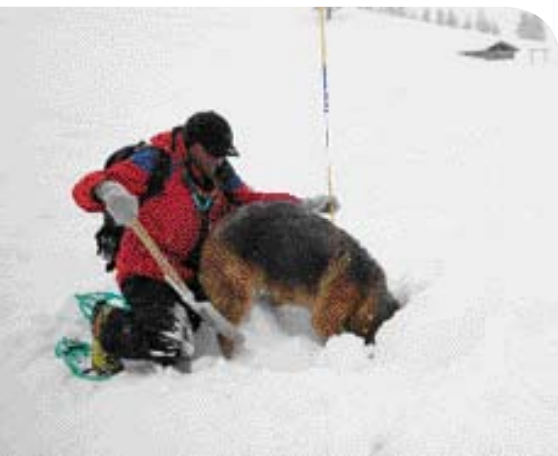
• Moderne lawinehond aan het werk in de Italiaanse Alpen bij Merano.

Opvallend is dat men er in de negentiende eeuw geen enkel bezwaar in ziet de slachtoffers zo dramatisch mogelijk in beeld te brengen. Foto's uit onze eeuw doen dat zelden of nooit. Maar, de moderne lawinehonden doen nog steeds hetzelfde werk als hun zeventiende eeuwse soortgenoten van het hospice eeuwenlang deden. Oftewel: Niets nieuws onder de zon... <