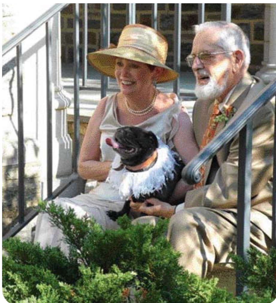
• Modern huwelijksportret. Ook deze hond is feestelijk 'aangekleed'.