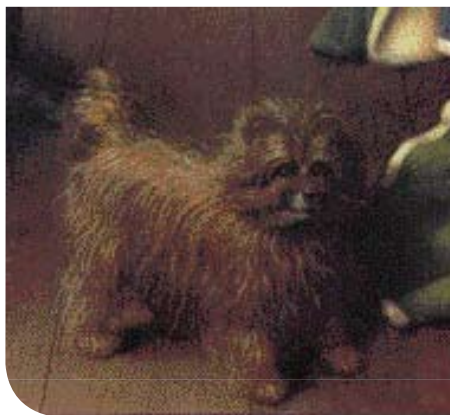
• Detail uit het werk van Van Eyck: een Griffonachtig hondje met een bruine golvende vacht.

We kijken naar een schilderij dat door Jan van Eyck (ca. 1390-1441) in 1434 wordt gemaakt. De meeste kunsthistorici noemen dit werk 'Het huwelijk van Giovanni Arnolfini en Giovanna Cenami' of 'Giovanni Arnolfini en zijn vrouw'. Zij wijzen op de symbolen in dit schilderij die op het huwelijk betrekking hebben. Eén van de aanwijzingen dat het om een huwelijk gaat, is de manier waarop Giovanni en Giovanna – afkomstig uit Italië – zijn vereeuwigd: staand en hand in hand. De opgestoken hand van de bruidegom, een rijke koopman-bankier, wijst op echtelijke trouw en de uitgetrokken houten pantoffels (trippen) kunnen