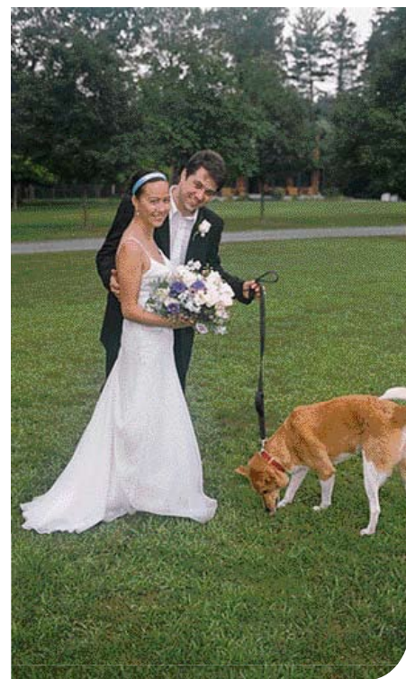
♦ Moderne bruidsreportage. Ook de hond gaat mee op de foto.

Als een bruidspaar zich nu met hun hond(en) bij het huwelijk laat vereeuwigen, vindt men dat misschien bijzonder. Dat is het niet. Immers, al eeuwen geleden worden honden betrokken bij deze feestelijke gebeurtenis in de familie; ze nemen zelfs een prominente plaats in op de hier afgebeelde schilderijen en foto's. Dus: niets nieuws onder de zon. ◀