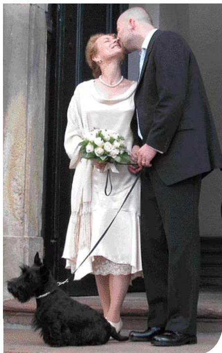
♦ Modern huwelijksportret. Deze Schotse Terrier is bij de ceremonie aanwezig. (Foto: Dreamskot).