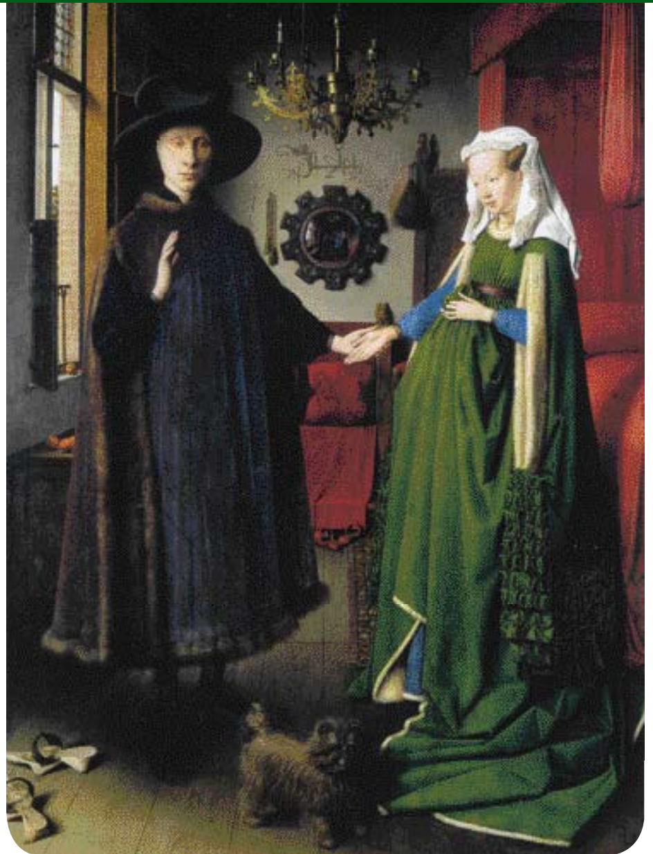
• Schilderij van Jan van Eyck (ca. 1390-1441) dat in 1434 wordt gemaakt: 'Het huwelijk van Giovanni Arnolfini en Giovanna Cenami' of 'Giovanni Arnolfini en zijn vrouw'.