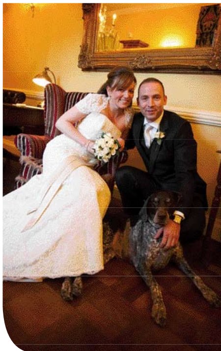
♦ Een modern huwelijksportret waarbij de hond een zeer prominente plek op de foto heeft.