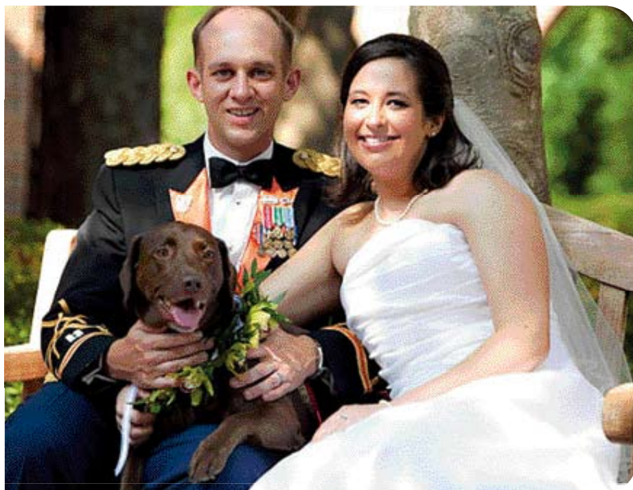
• Modern huwelijksportret met hond, in dit geval Labrador Lady, die op de feestelijkheden 'gekleed' is. .

De schilder is dus één van de aanwezigen bij het huwelijk.