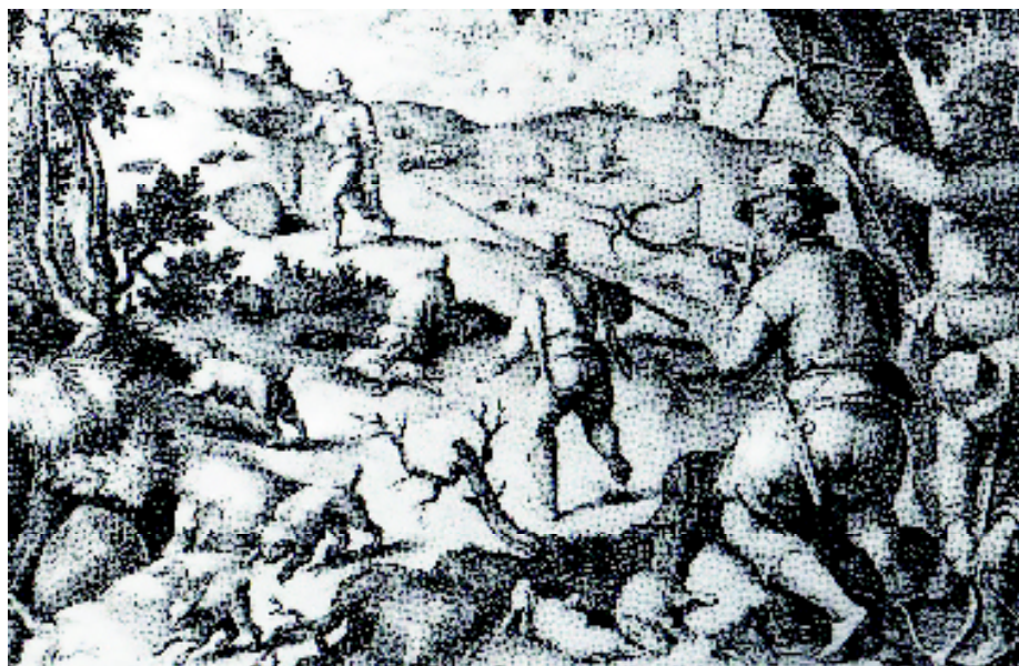
Een bekende prent van Johannes Stradanus van circa 1600 verbeeldt de konijnenjacht en daarop zijn, met een beetje fantasie, Teckelachtige hondjes te zien.