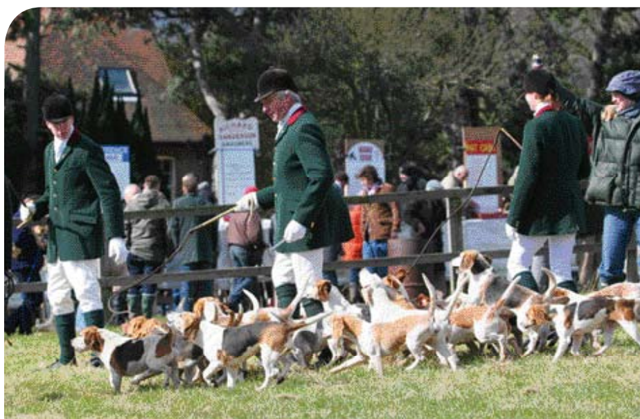
♦ De Pipewell Foot Beagles tijdens een demonstratie op het Festival of Country Life in Lamport Hall (Northamptonshire), in mei 2010.

Mevrouw Ottoline Baronesse van der Borch tot Verwolde – een bekende Beagle fokster – schrijft in december 1988 in Onze Hond: De meute werkt niet voor hun baas, zij werken niet voor de eer, zij werken samen om gezamenlijk het wild te achtervolgen . En dat nu is precies de kern van Beagling. ◀