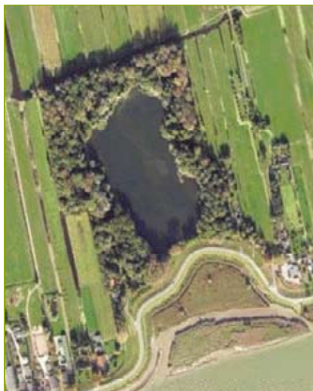
• De eendenkooi Bakkerswaal bij Lekkerkerk, gezien vanuit Google Earth.