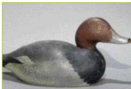
• Behalve een 'werktuig' bij de eendenjacht, is de houten lokeend ook een siervoorwerp geworden. Antieke lokeenden zijn zeer prijzig.